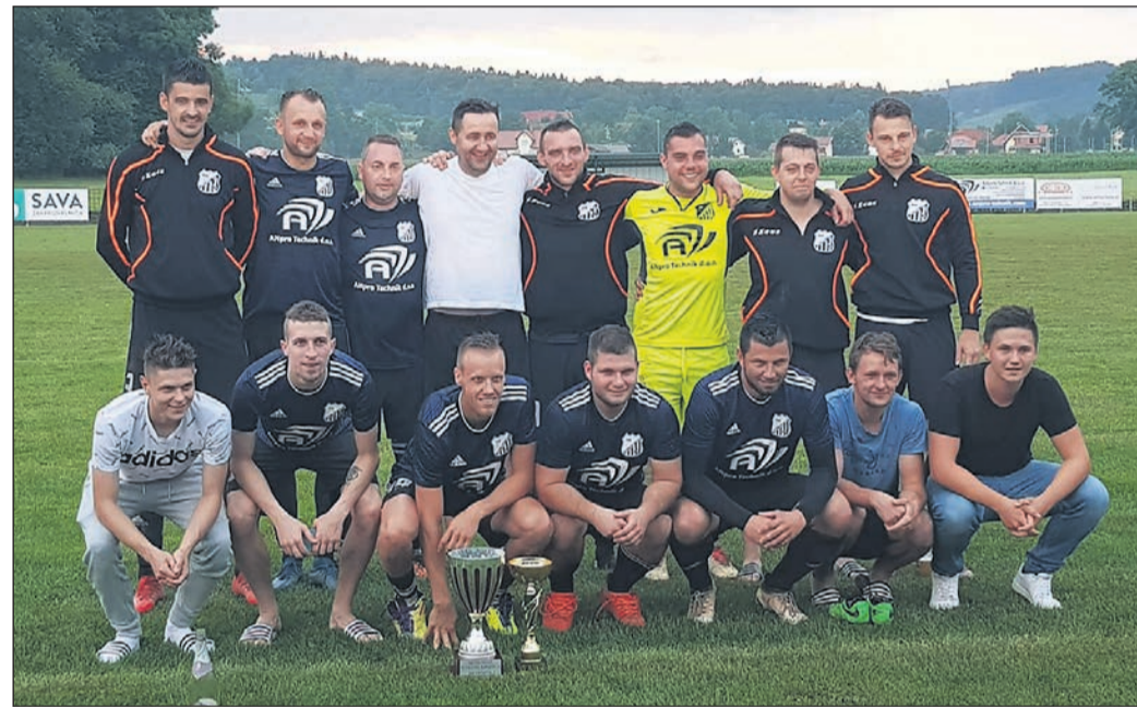
Ekipa NK Grajena – zmagovalci članskega turnirja