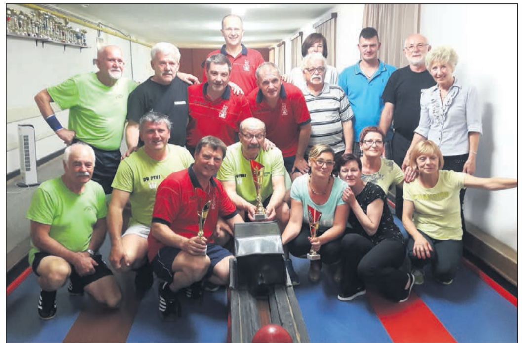
Najboljše ekipe borbenih iger 2019