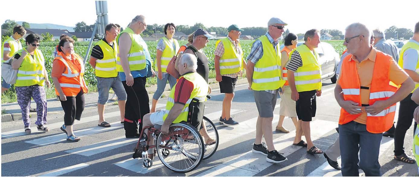
Približno 50 protestnikov je večkrat prečkalo cestišče.

Prebivalci ob državni cesti med Ormožem in Ptujem so z mirnima protestoma na kar dveh lokacijah, v Spuhlji pri Ptuju in prvič v Cvetkovcih v ormoški občini, izrazili nezadovoljstvo zaradi zamude pri umeščanju ptujske obvoznice in gradnji ceste od Ormoža.