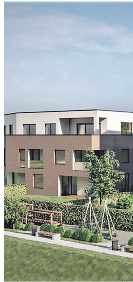
Taksen bo izgled dveh sodobnih večstanovanjskih ptujskega peš mosta.

Parcele, na katerih je gradnja načrtovana, ne ležijo v vplivnem območju kulturnega spomenika Ptuj – mestno jedro. Šlo naj bi le za nekaj metrov izven tega pasu. Ker je ptujski grad razglašen za kulturni spomenik državnega pomena, pa na pristojnem ministrstvu ugotavljajo, da vplivno območje poleg 300-metrskega pasu okrog spomenika obsega tudi ves odprti prostor v širši okolici, na katerem bi načrtovali objekte, ki bi s svojo velikostjo, obliko ali funkcijo lahko negativno vplivali na zaščitene funkcionalne in vizualne elemente spomenika. A glede na okoliščine primera naj bi bila ta dikcija neizvrljiva. Iz ministrstva so namreč