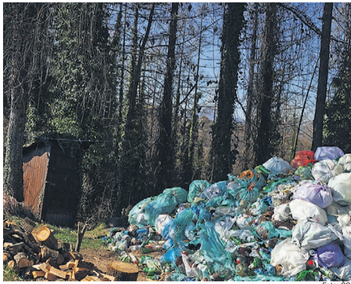
Smeti sicer skrbno zbirata v vreče, pri odvozu jima pomaga občina.

Kar se tiče makadamskih cest na eni in drugi strani hriba (do kmetije Bedrač in Drevenšek), bo občina letos poskrbela za gramoziranje. Na območju Leskovca je sicer še 60 kilometrov makadamskih cest, ki jih redno vzdržujejo. Vsako leto poskušajo asfaltirati katerega izmed odsekov, vendar so proračunska sredstva omejena. Asfaltiranje 1,5 km makadamske ceste do kmetije Drevenšek v Trdobjcih bi po grobih ocenah stala okoli 400.000 evrov. Občina Videm pa na letni ravni za vzdrževanje in modernizacijo vseh cest porabi nekaj več kot 300.000 evrov. Pred dvema letoma so sicer na tem območju asfaltirali 300 metrov dolg odsek v bližini glavne ceste.