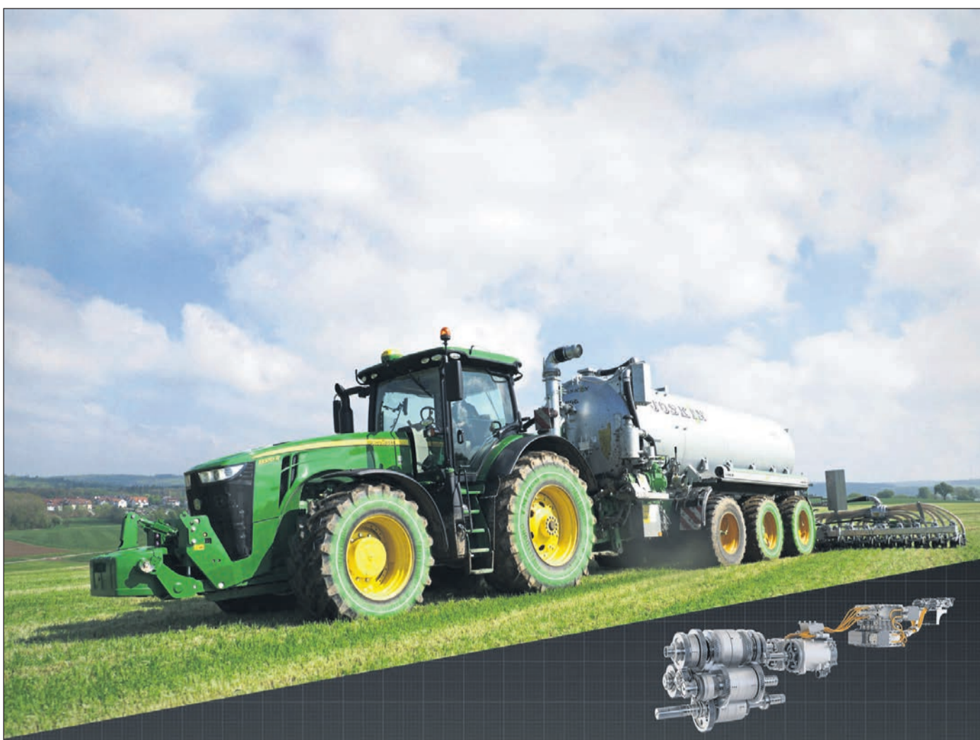
Študijska kombinacija traktorja z notranjim generatorjem in pogonom dveh osi (4 koles) cisterne za gnojevko. Nagrajena tehnična novost na razstavi Agritechnica 2019.

Veliko dlje je razvoj električnih baterijskih pogonov pri dvoriščni mehanizaciji, npr. pri dvoriščnih nakladalnikih ali teleskopskih nakladalnikih, ki so po namenu in tehnologiji blizu električnim vilicarjem, ki so že dolgo v uporabi. Te stroje uporabljamo veliko krajši čas, nekaj ur za nakladanje, vmes pa je čas za polnjenje baterije. Poleg tega so ti motorji relativno majhnih moči (v primerjavi s traktorji), zato je velikost baterije lahko primerna za vgradnjo vanje. Ti stroji so že na trgu, tudi v Sloveniji. Cena je višja od strojev, gnanih z motorji z notranjim izgorevanjem, zato jo je treba upravičiti z drugimi prednostmi električnega pogona.