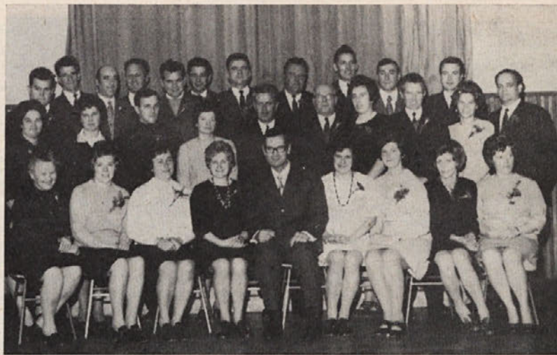
DESETLETNIKI DELA V PODJETJU

Stanje zaposlenih na dan 30. 11. 1970: 551 žena in 199 moških, skupaj 750 delavcev.