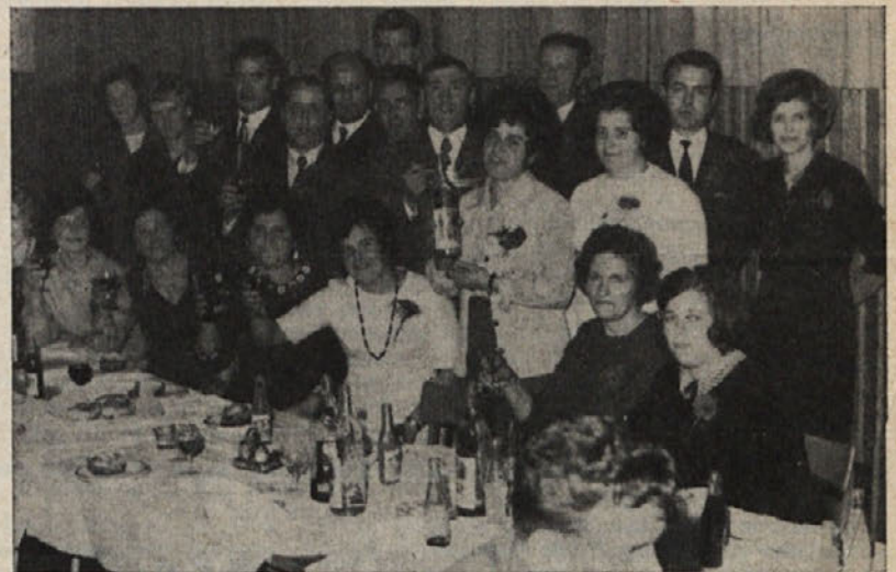
PA PRAVIJO, DA SO PRI NAS EKONOMSKE ENOTE SAMO NA PAPIRJU! TILE SLAVLJENCI IZ EE TKALNICE PA SO SE STRNILI SKUPAJ KOT PISCETA IN BOG NE DAJ, DA BI SE SKUŠAL KDO DRUG PRISTULITI ZRAVEN