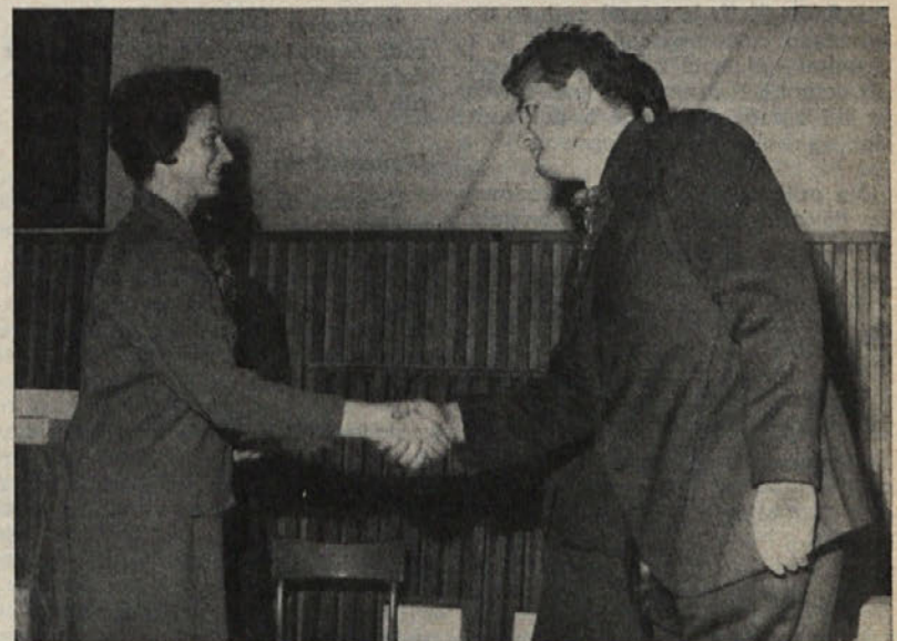
ZA SPOMIN NA DVAJSET SUHIH IN DEBELIH LET (ZADNJIH SEDEM JE BILO, KAKOR JE UREDNISTVU ZNANO, BOLJ SUHIH)

ZA NJIHOVO DOSEDANJE DELO SE JIM ISKRENO ZAHVALJUJEMO!