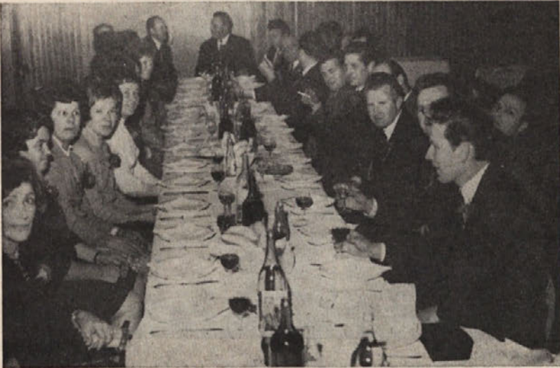
KAKO BO SELE DOLGA MIZA PRIHODNJE LETO, KO BO PRITISNILA »DESETLETNA« PREDILNICA! TO BO VESELO!