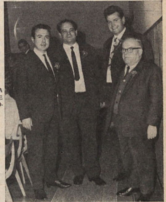
ZGODOVINA NAS UCI, DA SE V VSAKI DRUŽBI NAJDE ELITA, KI SE LOČI OD MNOŽICE