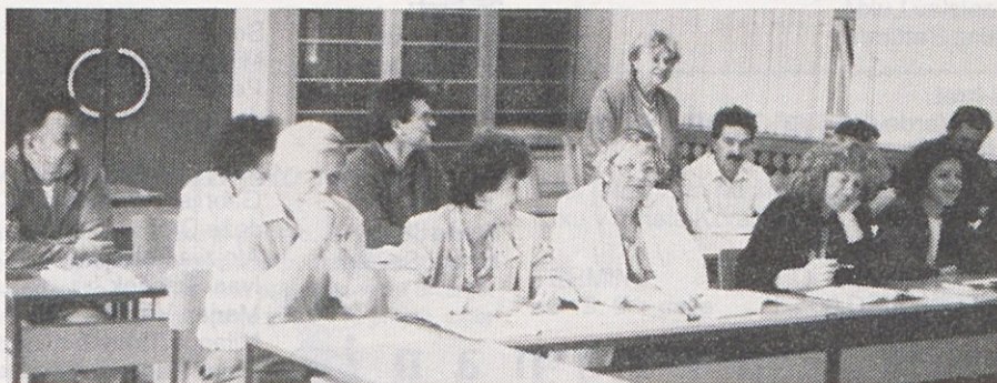
Delavci Gorenja Gospodinjski aparati na tečaju nemščine