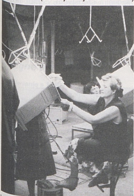
Le še do kolektivnega dopusta po stari, že dotrajani tehnologiji v emajlirnici Kuhalnih aparatov. Pri novi peči ne bo več tako vroče.