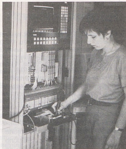
V demonstracijskem vozilu Siemens so si lahko delavci Gorenja ogledali delovanje elektronskega kompleta SIMATIC 5S