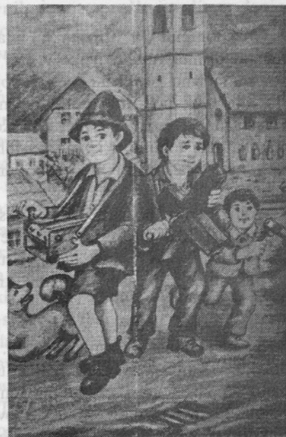
Ragljači - slika po spominu Risal Janko Čadež