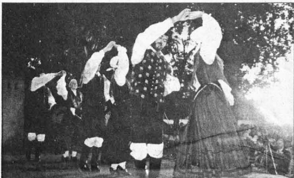
Folklorna skupina s Pristave