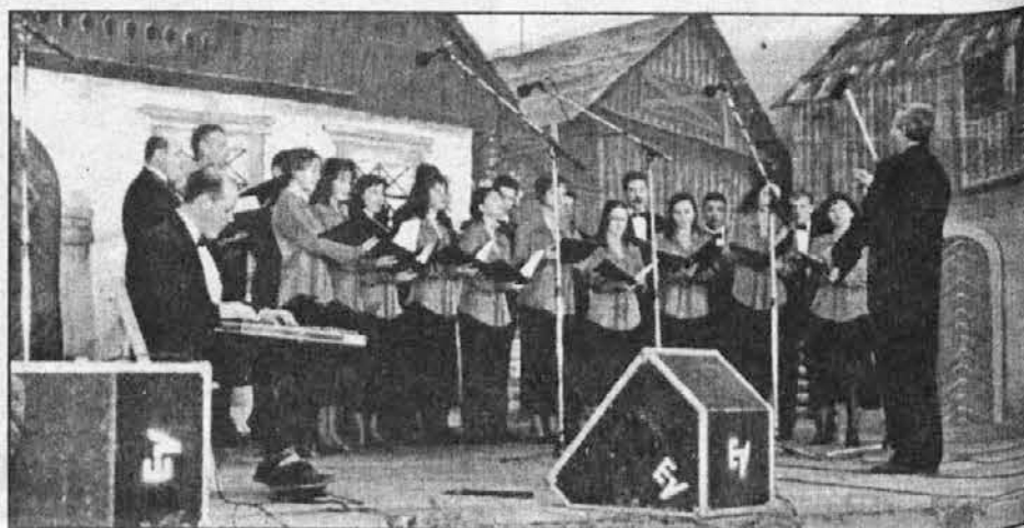
Domžalski komorni zbor