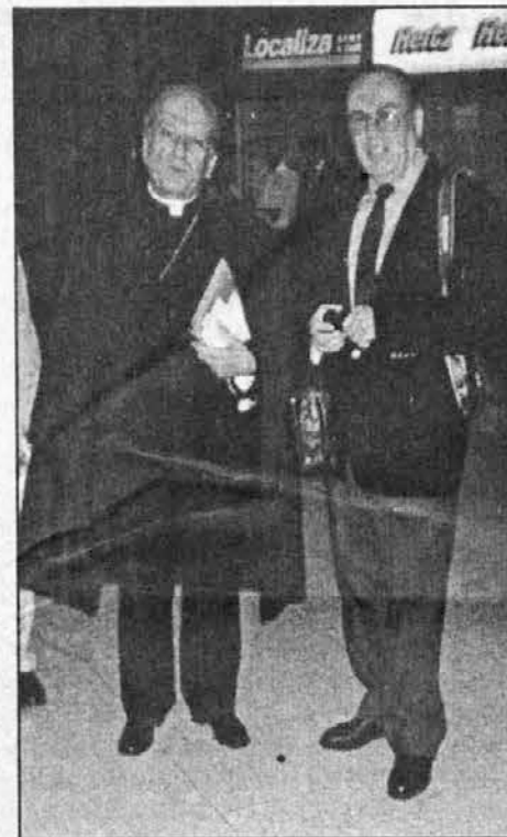
Ob odhodu na Ezeizi.