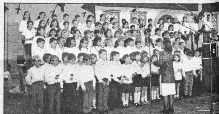
Otroci osnovnih šol med petjem