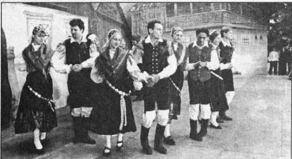
Plesalci iz Slovenske vasi