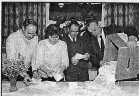
Preštevanje glasov v Sloveniji

Izvoljeni predsednik RS Milan Kučan pa se je volilcem zahvalil in poudaril, da prevzema svoj del odgovornosti, „da bomo življenje v naši državi skupaj uredili tako, da bo prijazna vsem državljanom, tudi tistim v stiskah in negotovosti, da bodo v njej spoštovani in da bo spoštovana tudi v tujini“. Treba je zato obrniti pogled v življenje in zapreti rane preteklosti in si zagotoviti prihodnost.