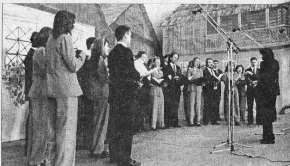
Mladinski pevski zbor iz San Justa