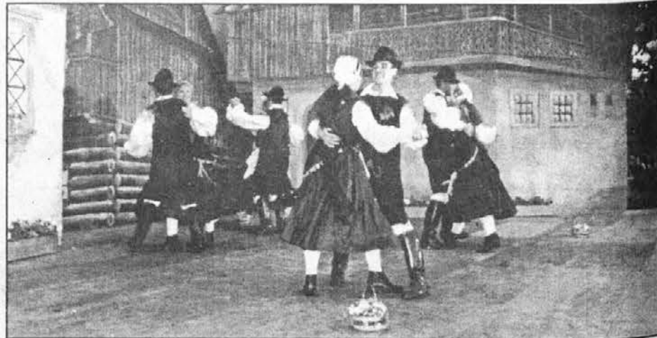
Folklorna skupina Maribor iz Carapachaya