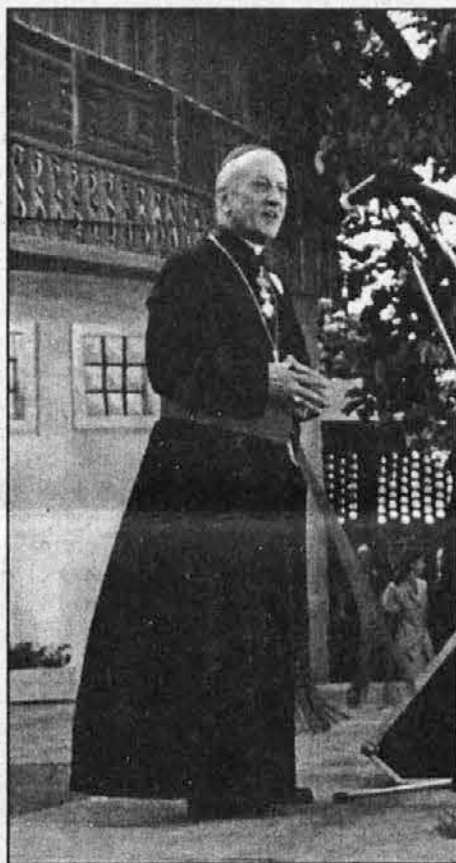
Nadškof pozdravlja na Slovenskem dnevu

Ko nas je prvo leto po naselitvi v Argentini obiskal vaš slavní prednik - škof begunec - dr. Gregorij Rožman, nam je naročil: „Povežite se med seboj! Držite enotnost in edinost, v kateri smo močni in lahko kaj dosežemo!“ Njegovo naročilo in prošnjo smo sprejeli, življenjska izkušnja