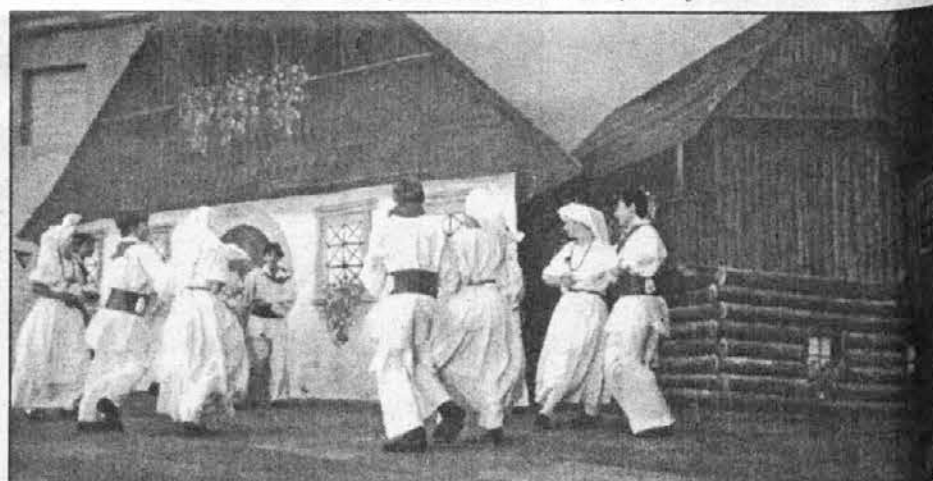
Mladinska folklorna skupina s Pristave