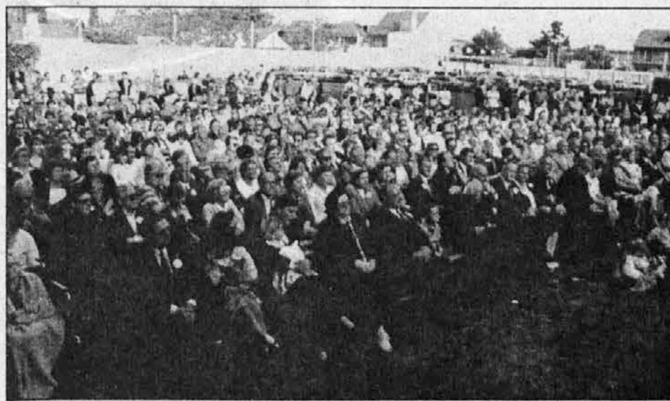
Del zbranih rojakov na kulturnem programu

„V ljudeh vidim tebe, domovina!“ Kot pred 50 leti, je naša skupnost še vedno potrebna tako starejšim kot mlajšim. To je naše naravno okolje v katerem se počutimo na svojem. Tu se lahko udejstvujemo in razvijamo v zdrave slovenske in krščanske osebnosti. Povezani v tej skupnosti bomo najbolj in najlažje koristili Sloveniji in Argentini, najbolj pa sebi in svojim. Pri tem nam Bog pomagaj!