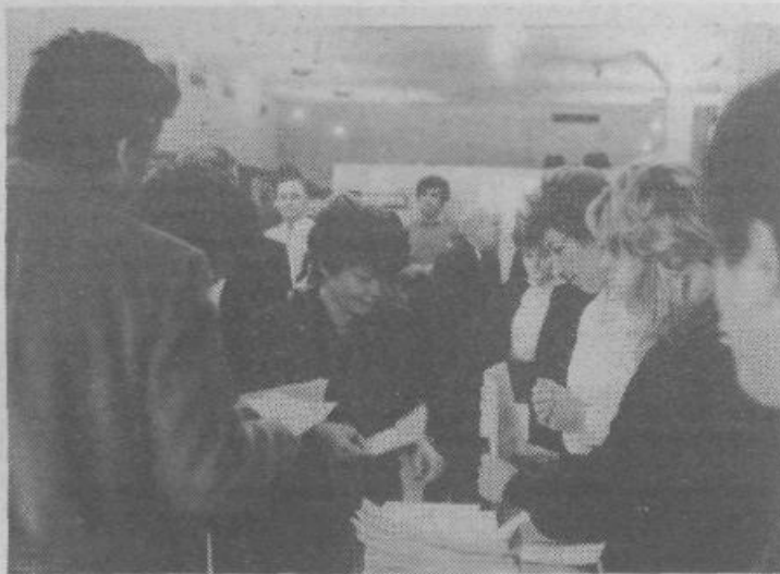
Ze pred sejo OK ZKS je bilo živahno. Delegati so oddali poverilnice in prejeli še nekaj gradiva

stema komunisti podpiramo vse tiste predloge, ki zagotavljajo krepitev ekonomskih zakonitosti, sproščanje blagovno tržnih odnosov, osebne inovativnosti ter krepitev odgovornosti delavcev pri upravljanju s sredstvi v družbeni lastnini. Ker se ustavne razprave še nadaljujejo, je poglavitno, da se komunisti prizadevno vključimo v vse razprave, ki jih organizirata zveza sindikatov in socialistična zveza ter tam zastopamo usmeritve zveze komunistov, ki zadevajo spreminjanje ekonomskega in političnega sistema, racionalizacijo delegatskega skupščinskega sistema, uveljavljanje republike kot samoupravne socialistične skup-