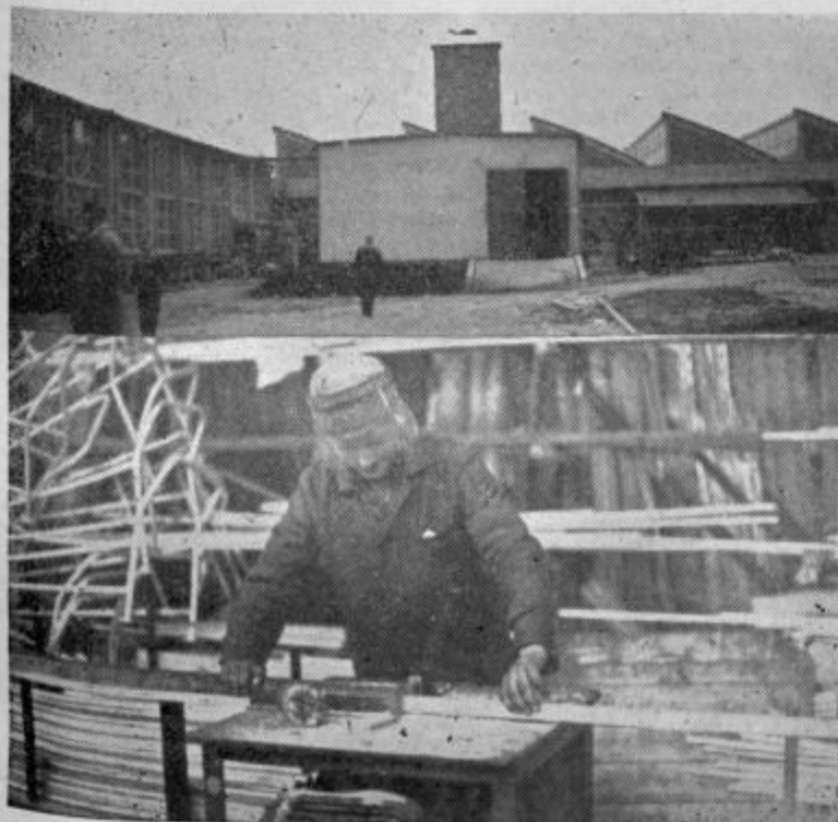
Zgoraj obe novi proizvodni hali v Sentjurju, spodaj delavec pri rezanju aluminija