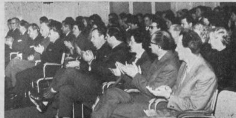
Knjigovodje in gostje na občnem zboru

V dosedanjem delu je posvetilo največ pozornosti strokovni vzgoji kadrov. V sodelovanju z delavsko univerzo so v teh letih organizirali vrsto tečajev, v katerih je izpopolnilo svoje znanje preko 1.000 knjigovodij. Tečaje so imeli v več stopnjah. Razen tega je društvo občansko organiziralo številna predavanja o aktualni problematiki in še posebno seminarje za določene naloge. Na ta način je društvo odigralo pomembno vlogo in nudilo pomoč gospodarskim organizacijam, saj so bili knjigovodje spričo pogostih sprememb in dopolnitev predpisov pred odgovornimi in težkimi nalogami.