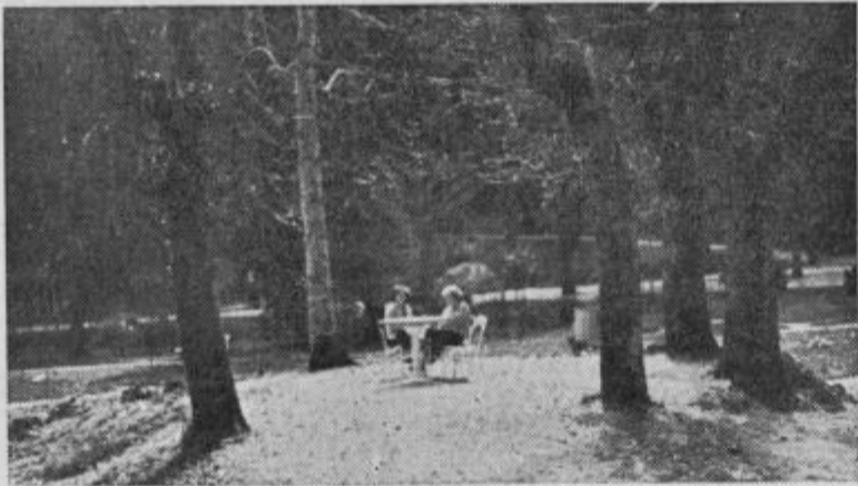
Prijeten je počitek v dobrnskem parku

Drugače je bilo v nekaterih drugih kmetijskih organizacijah, ki so, da bi se izognile finančnim težavam, preprosto prenehale s proizvodnjo mleka. To in pa dejstvo, da zasebni kmetovalci vse bolj opuščajo proizvodnjo mleka, problem še bolj zaostruje. Hkrati pa organizirana vzgoja in selekcija mlekaric tudi zagotavlja pravilno oskrbo. Gotovo je namreč, da je farmska oblika proizvodnje mleka neprimerno bolj kontinuirana in tudi cenejša. Vzemimo za primer samo šmarsko območje. Tu proizvodnja mleka pri zasebnikih niha od 8 tisoč litrov mleka dnevno do 2 tisoč litrov v zimskih mesecih. Pri farmski proizvodnji pa so tako ostre konice odstranjene. To pa je predvsem za pravilno oskrbo mesta pomembno in je zaradi tega nujno urediti doslej še nerešene probleme, ki bi znali škodovati in zavirati nemoten razvoj farmskih obratov. -le