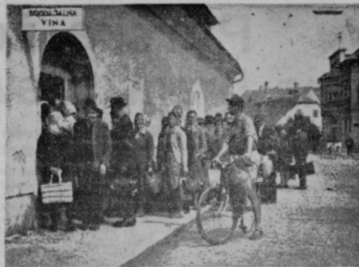
Kaj priteguje toliko kupcev v klet »Slovenskih goric«; poletna žetva, nizke cene ali kvaliteta?

Gospodarska reforma je prinesla v naše gospodarstvo številne spremembe, ki jih zahteva naš družbeni razvoj. Iskanje notranjih rezerv in znižanje stroškov proizvodnje, boljša organizacija dela, večja produktivnost dela in drugo je v sedanjem obdobju ena izmed poglavitnih vprašanj v našem gospodarstvu. Vprašanje ostane, kje iskati notranje rezerve pri krajevnih skupnostih? Vedeti je treba, da se delo krajevnih skupnosti lahko tudi nemoteno razvija brez rešnje zaposlenih tajnikov, kar dokazuje krajevna skupnost Podgorci in druga. Redno zaposleni tajnik krajevnih skupnosti je breme, ki ga je treba plačati s krajevnim samoprispevkom in delno z dotacijo občinske skupščine. Če je tako, potem krajevni samoprispevek ni namensko izkoriščen, saj je bil namenjen za urejevanje cest, popravilo mostov, brvi in podobno. Ta sredstva so zbrana od občanov in bi morala biti v celoti namenjena za razvoj kraja.