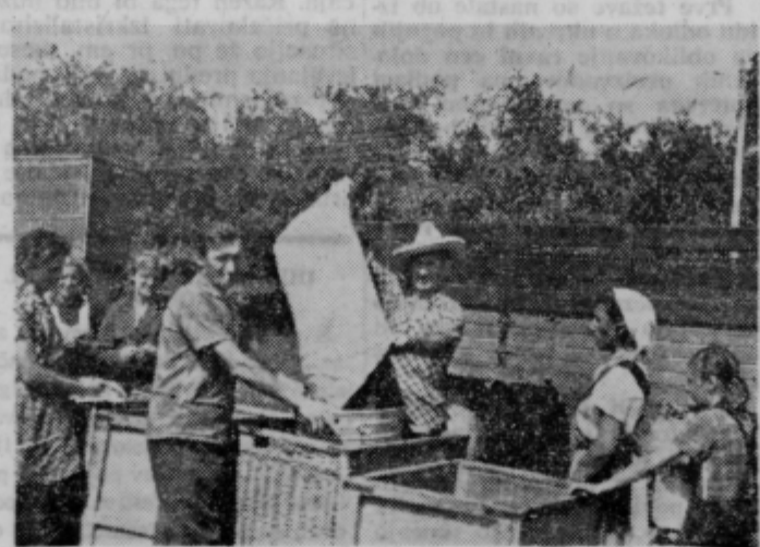
Hmelj prevzema prvi hmeljar z velikim slamnikom