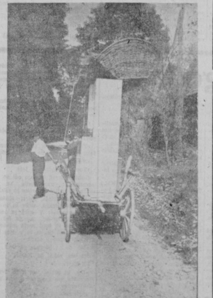
Neiznajdljiv voznik je vrh kredence naložil vozovni koš. Vprašanje je, če ga je dobro privezal, da ne bi padel dol ali drugače oviral prometne varnosti, kajti za vožnjo v oddaljene kraje mora biti slihero vozilo primerno opremljeno, bolj kot ta voz na cesti v Podvincih.