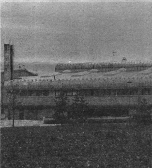
Osnovna šola na Črnučah, zgrajena z drugim samopriskom.