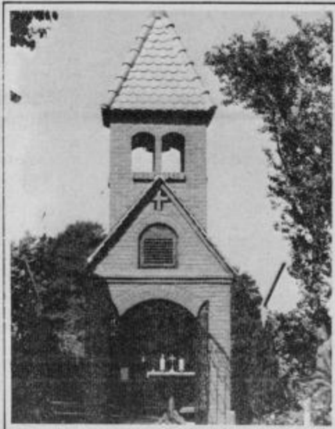
Vsa družina skrbi, da je kapela vedno urejena