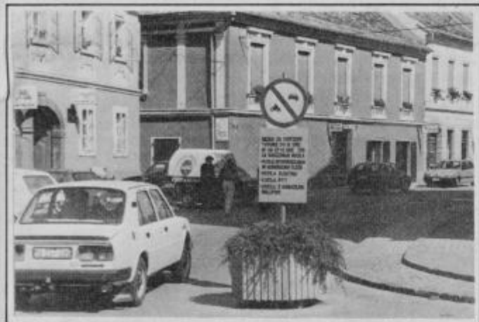
Kljub znaku — hajd v Krempljevo ulico

Dejansko stanje je v precejšnjem nasprotju s predpisi. Stranske ulice v zaprtem delu mesta so zatrpane z avtomobili. Po ulicah, kjer naj bi se sprehajali pešci, drvijo avtomobili, mopedi, kolesa. Avtomobili brez nalepk, ki bi jim to dovoljevale, se mirno pripeljejo do trgovin in tam počakajo na svoje lastnike, da opravijo nakup in se mirno zapeljejo mimo znaka, ki ga prej niso upoštevali. Dostava je dovoljena do osme ure zjutraj ter med 12. in 13. uro popoldan. Tovornjaki pa — morda izjemo-