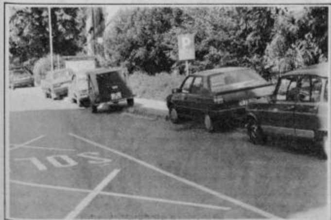
Kod naj hodijo pešci?

K pisanju o komunalni nadzornici in njenem delu sodi še opis odnosa voznikov do delilke kaznovanih listkov. Mnogi jo obdelajo z neprijaznimi besedami in celo grožnjami, del štajerske folklorne doživljajo tudi na inšpekcijski upravi. Tam se lahko občan sicer pritoži in se poskuša razbremeniti kazni. Toda v tem primeru dajo vse skupaj v presojo sodniku za prekrške. Tam kazni sicer ne zvišajo, dodajo pa stroške postopka in na koncu je v žepu še nekaj večja luknja. Rešitev za mesto in za žep voznikov je torej v upoštevanju prometnega režima. Na dohodih k mestu je nekaj dodatnih parkirnih površin (ob železniški postaji, za lekarno, za avtobusno postajo), sicer pa nobeno parkirnišče v mestu ni tako zasedeno, da ne bi mogli najti prostora še za naše prevozno sredstvo.