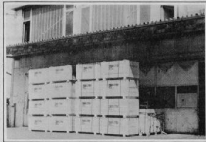
Posiljka za Egipt čaka