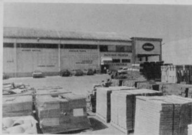
Razstavno prodajni center

n.c. 611-147, 611-331 direktor 611-575 komerciala 611-260, 611-261 telefax 611-669 telex 33293 SLOLES YU