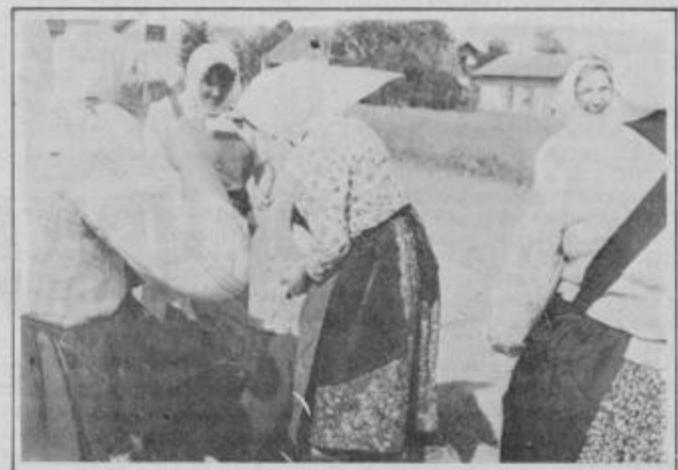
Tudi minister za turizem je bil deležen lükarških radosti...

V lükarškem društvu pravijo, da so z nedeljsko prireditvijo prestali krst,