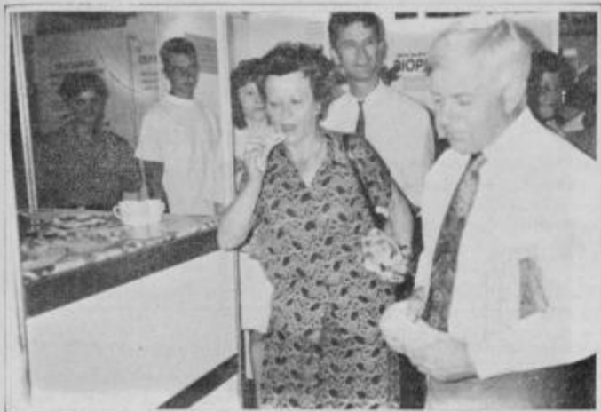
Ob otvoritvi se je ob stojnici ptujske Kmetijske šole ustavil tudi predsednik Milan Kučan.

Pobuda za sodelovanje na sejmu je rezultat dragocenih izkušenj, ki smo jih pridobili na sejmu učil in opreme v letu 1991; poleg tega kmetijske šole pogosto vidimo na raznih lokalnih kmetijskih razstavah in srečanjih. Dejstvo, da nam sejmski utrip že doslej ni bil tuji, govori o tem, kako živo so šole povezane s okoljem.