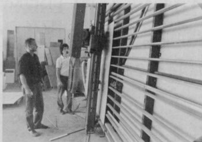
Razrez materiala po vaših željah in zahtevah