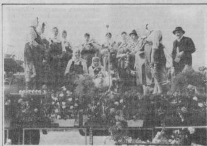
Lükarice so svoj prvi praznik pričele z Lükarško himno.

O tem, kje je pravzaprav središče Lükarije, so med vasmi podobne polemike kot o izvoru koranta. Seveda so lük sadili skoraj po celotnem Ptujskem polju, a središče Lükarije je bila Dornava. O življenju dornavskih Lükarjev je pisal že Ingolič v romanu Lükarji . Imeli smo občutek, da so Dornavčani in bližnji Mezgovčani ob hitrem razvoju krajev že nekoliko pozabili na to kulturo in običaje.