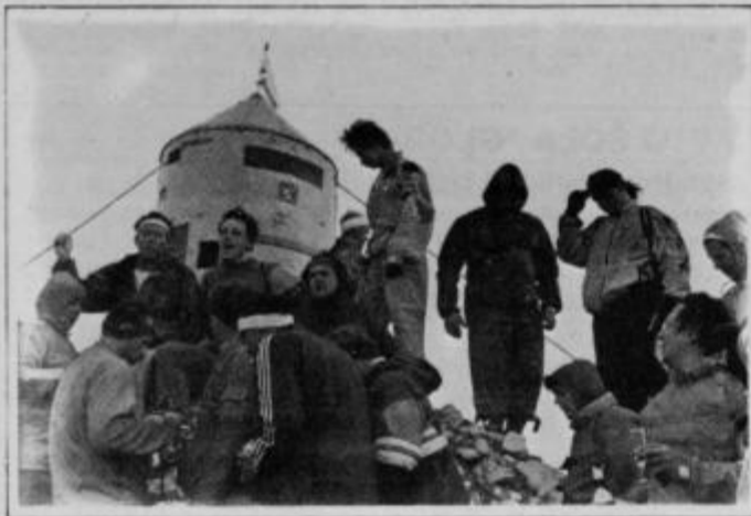
Ptujski komorniki so v okrnjeni sestavi ob svoji 40-letnici zapeli na vrhu Triglava.

Te čudovite, že skoraj ponarodele verze znamenitega župnika in ljubitelja planinstva Jakoba Aljaža so v nedeljo, 30. avgusta, nekaj pred deseto uro zazvenele iz ust pevcev komornega moškega zbora iz Ptuj. Pa to sploh ne bi bilo nič posebnega, če se vse skupaj ne bi dogajalo 2864 m visoko, ob Aljaževem stolpu na vrhu Triglava.