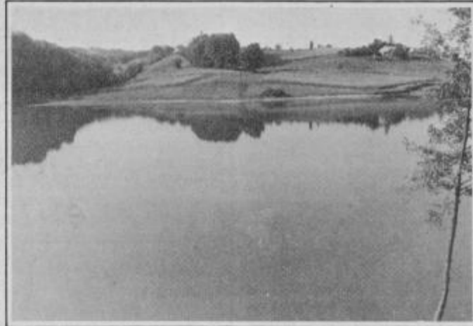
Ob podlehniškem ribniku je vsak dan lepše