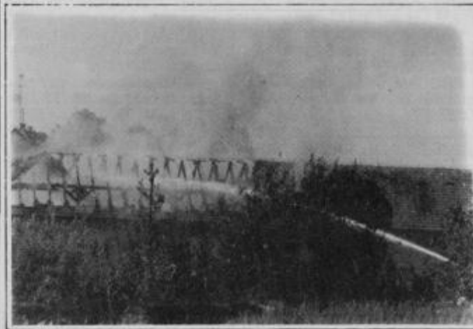
Gasilci so hitro posredovali, kljub temu je škoda na zgradbah Surovine ogromna.

Najprej zavijanje sirene, nato pa gost dim in vonj po ožganem je v nedeljo popoldan vznemiril vse Ptujčane in bližnje okoličane. Mesto je oživel, radovedneži so se zbirali na levem bregu Drave, najbolj vztrajni pa povzročili skorajda zastoj čez dravski most. Gorela je zgradba Surovine na desnem bregu Drave.