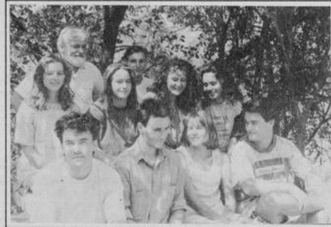
Udeleženci taborov so ob raziskavah dodobra spoznali haloško življenje.

Velik problem je za haloško mladino tudi oddaljenost srednje šole, do katere porabi kar tretjina vprašanih skoraj uro, prav toliko pa tudi za vrnitev domov. Tako pomeni obiskovanje srednje šole za te dijake kar dve uri dnevno več kot na primer za mestne. Najbolj peče pa je finančno breme, saj porabijo za prevoz kar 3000 tolarjev mesečno. Veliko vprašanih je odgovorilo, da bodo nadaljevali šolanje, če bodo dobili štipendijo.