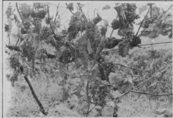
Iz teh "rozin" ne bo mošta.