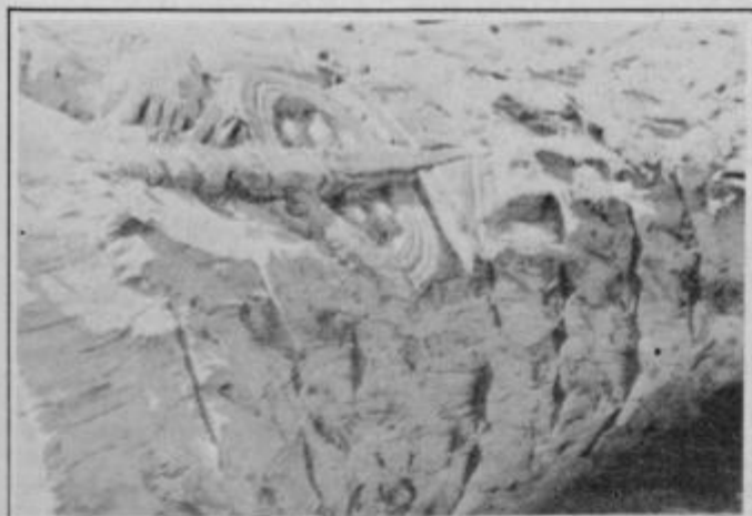
Hrastovo deblo z nekaj motivi