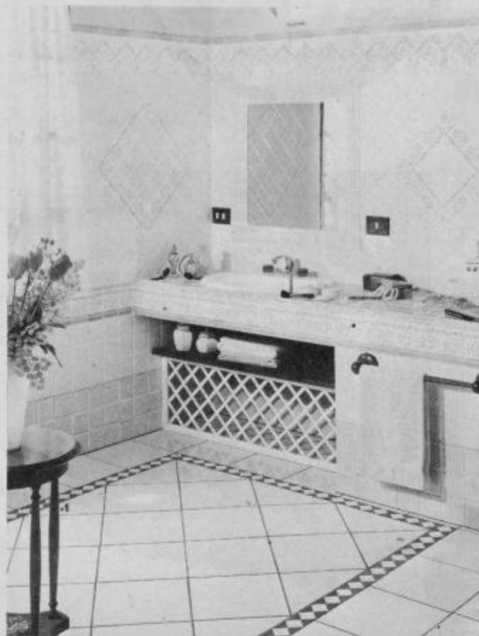
Velika izbira italijanskih keramičnih ploščic in sanitarne keramike