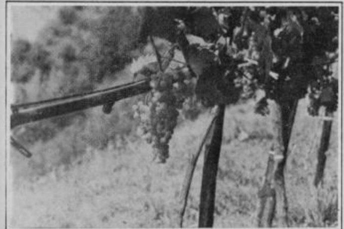
V tem namakanem vinogradu bo tudi letos kaj trgati.

zgoraj postavljene desetkubične cisterne in potreben pritisk ustvarja s prostim padom. V eni uri pritečejo iz vsakega kapljača štirje litri vode. Najbolje je namakati ponoči oziroma zjutraj. Sistem je priporočljivo opremiti z uro, ki ga vklaplja in izklaplja v določenem času. Učinki namakanja so dobro vidni, saj je vinograd kljub še posebej poudarjeni suši v sosednjih vinogradih v zelo dobrem stanju; že po zelenju se loči od drugih.