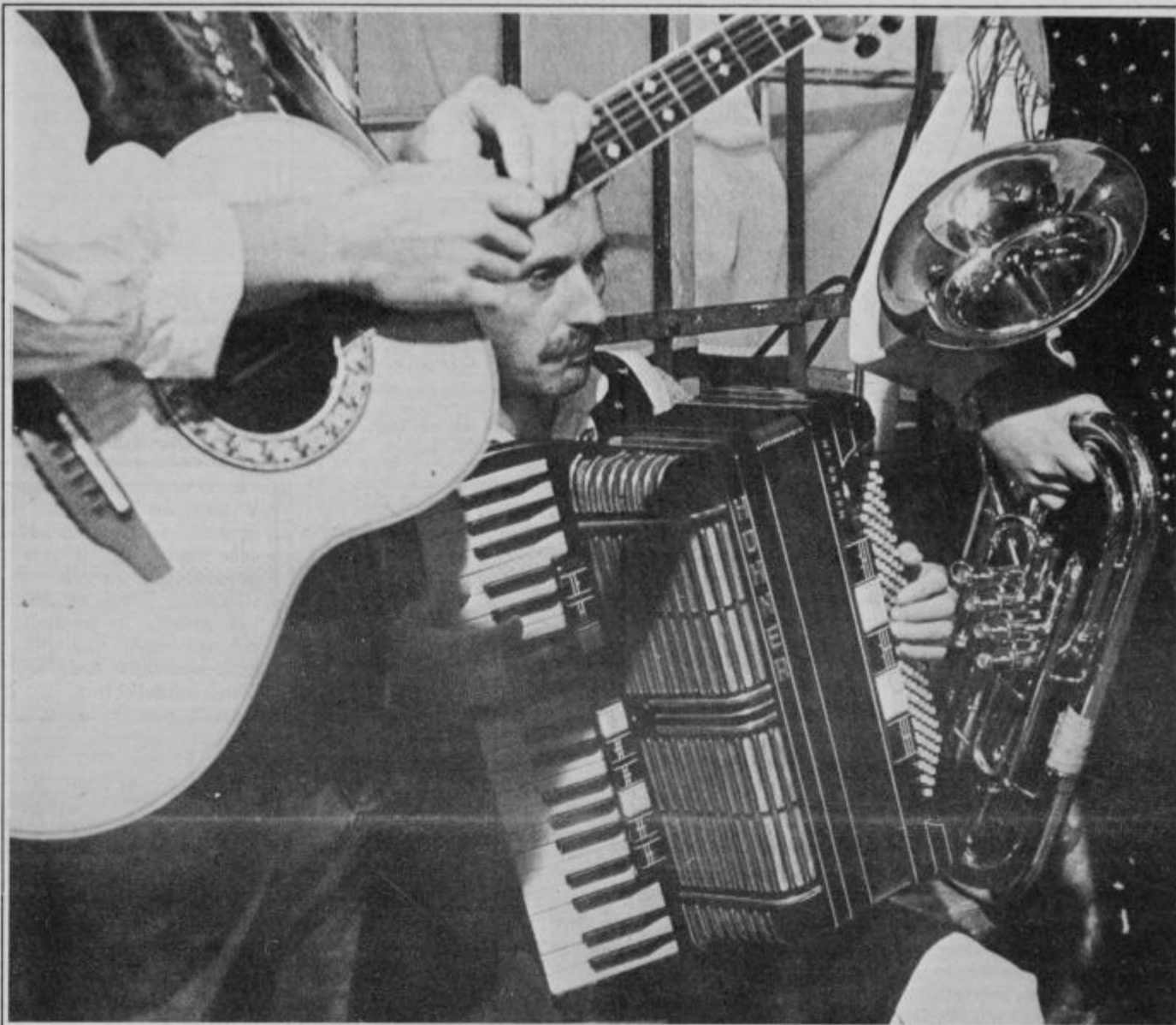
PRIŠEL JE DEŽ — IN PTUJSKI FESTIVAL Tremo pred nastopom vsak po svoje premaguje. Po harmonikarju spoznamo, kako so se pred leti pripravljali na festivalski nastop člani ansambla Trim iz Maribora.