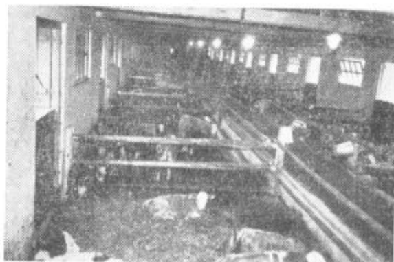
27. novembra so v Šetarovi odprli nove sodobno urejene hleve. Notranjost enega od treh hlevov, last Agrokombinata KZ Lenart.