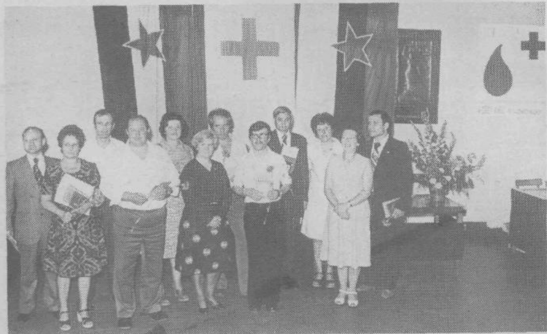
Spominski posnetek letošnjih odlikovancev, ki so darovali kri nad 25-krat. Med njimi so tudi predstavnice občinske in mestne organizacije RK