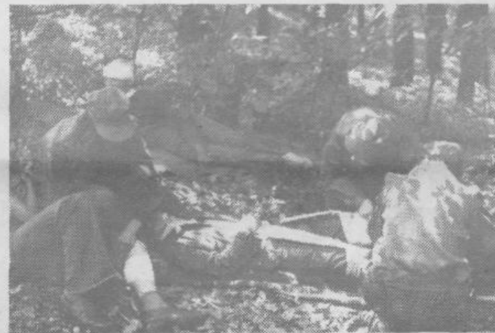
Po spopadu z zasedo je bilo treba z bojišča odnesti ranjence na varnejši kraj, kjer so jim dali prvo pomoč in poskrbeli za nadaljnji transport huje poškodovanih.