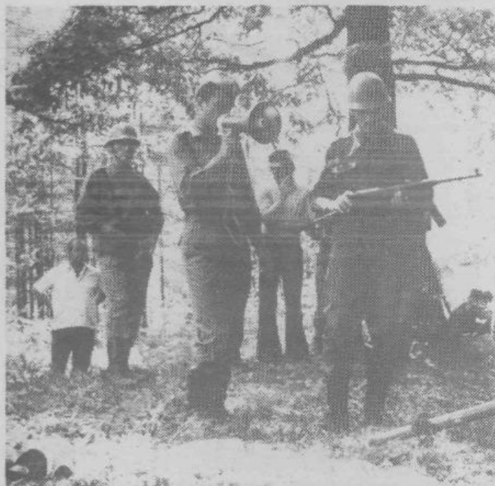
Razlaga o brzostrelnem orožju