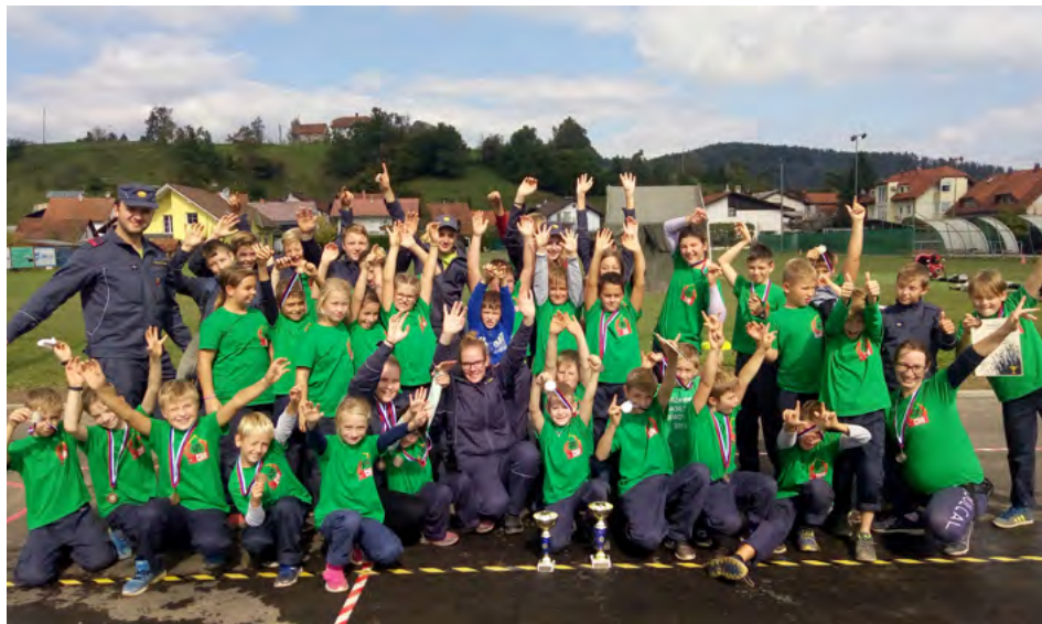
Rovtarska gasilska bodočnost

Glavna skupina v vsakem gasilskem društvu je seveda operativa, ki pri nas venomer šteje prek 50 gasilcev. Preveč, smo tudi že slišali. A dejstvo je, da nimamo operativca, ki ne bi bil letno vsaj na nekaj vajah in zadostil vsem merilom in pogojem biti operativni član društva. Zagotavljanje varstva pred nesrečami vseh vrst ob kateremkoli času je naloga, ki jo jemljemo kar se da resno. Ob takem številu operativcev nam ni tuje dejstvo, da pri posredovanjih izven domače občine gasilski zvezi stalno zagotavljamo kar polovico potrebnih sil. Tu velja omeniti, da ob posredovanjih na gozdnih požarih veliko vremo do dela pokaže enota Petkovec. Redne mesečne in mnoge izredne vaje nam dajejo znanje, potrebno za posredovanje na intervencijah. Število intervencij je za nekatere veliko, za druge majhno. Pa vendar smo v zadnjih desetih letih skoraj sedemdesetkrat priskočili na pomoč svojim krajanom in širše. Prav vsakokrat je treba pokazati zvrhano mero znanja in strokovnosti, za doseganje tega pa si po-