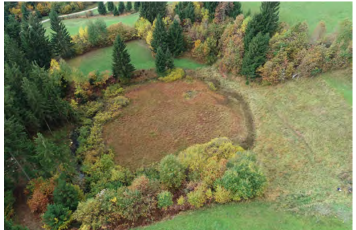
Naravni rezervat Jezerc

tovev teh kazalnikov mora Občina Logatec modernizirati štiri počivališča ob cesti Planina – Grčarevec in urediti dve parkirišči. S tem bo zagotovila 92 parkirnih mest (49 osebna vozila, 40 motorji, 3 avtobusi oz. avtodomi). Od teh jih bo 11 avtomobilskih (1 v Lazah, 10 v Grčarevcu) namenjenih dolgotrajnejšemu parkiranju, enako bo s 6 motorističnimi v Grčarevcu, medtem ko bodo vsa ostala, ki bodo na počivališčih, namenjena kratkotrajnemu parkiranju. Občina Postojna bo v Planini uredila večje parkirišče, na katerem bodo mesta tudi za avtodome.