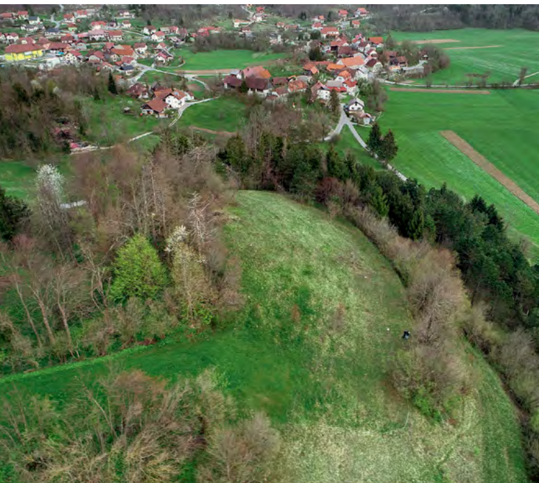
Pogled na lokacijo bodočega razgledišča nad Planinskim poljem

netrajnosti kmetijskih praks. Uradni opomin je začetek postopka zaradi kršitve zakonodaje Evropske unije, kar pomeni velik pritisk na državo, da stvari uredi. Hkrati gre za svarilo tudi lokalnim skupnostim, zato so vse tri občine, na območjih katerih se razteza Planinsko polje (Logatec, Postojna in Cerknica), na pristojno institucijo - Zavod RS za varstvo narave že naslovile prošnjo za pripravo smernic za sprejem pravnega akta o zavarovanju Planinskega polja kot zavarovanega območja.