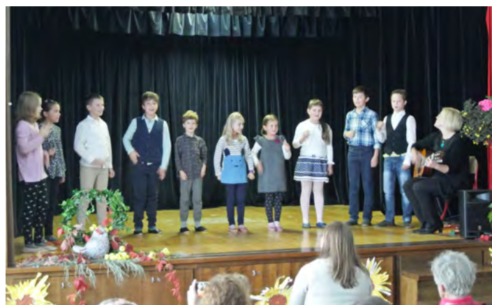
Obetavni in navdušujoči zvoki malih Vrhovcev.