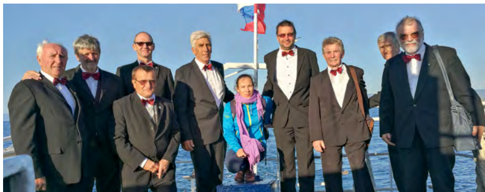
Logaški pevci so navdušili tako občinstvo kot tudi kolege pevce in organizator je UO Pa kolkr tolk povabil k sodelovanju tudi prihodnje leto.

S turistično ladjo Laho smo se pevci odpeljali na točko nad potopljenim Triglavom in si zapeli. Sodelovali so domači pevci Georgios v oktetrovski in mešani izvedbi, BeJazzy iz Ljubljane, ŽPZ KD Korte, skupina Vocalix iz avstrijskega Weiza ter zbor Zirberklang iz Judenburga. Logatčani smo se imenitno odrezali s Švikaršičevo Pojdam u rute s solistko Urško Šemrov, seveda pa smo zapeli tudi druge pesmi iz našega repertoarja.