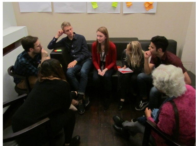
Delo v delavnicah.