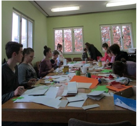
Mladi izdelujejo darilca za starejše.

Kot vsako leto so bili otroških darilc in njihovega obiska vsi povabljeni zelo veseli in se prijazno zahvalili. Na društvo smo prejeli celo pisno zahvalo od ene izmed udeleženk srečanja. Naši mladi člani pa so bili ponosni na svojo akcijo.