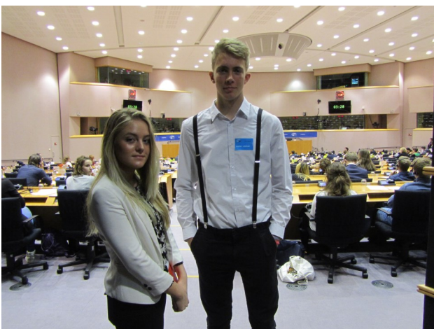
Kaja in Ciril v Evropskem parlamentu.

Eurochild bo pripravil Strategijo o participaciji otrok, ki jo bo sprejel predvidoma aprila 2017, ko bo zasedanje njihove skupščine.