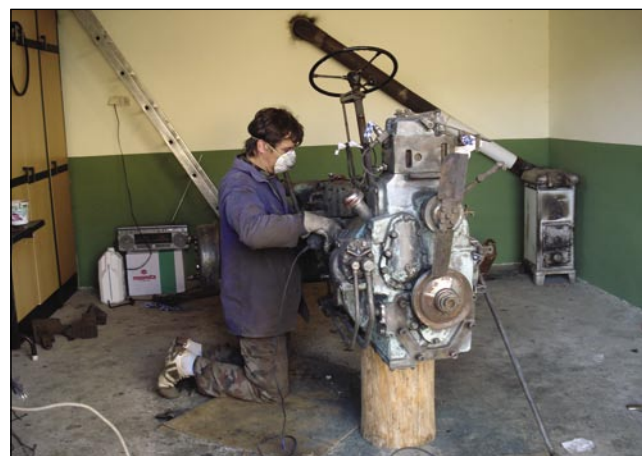
Traktor se brž raznokpobere, dapa nazaj se že žmetneje napravi

bilau tak čisto enostavno, ponoriji sem ga kūpo. Z ednim sem gnauk vkūpprišo, on je šlosar pa je ranč eden traktor popravlo, pa sva se nika od stari traktorov pogučavala. Te pa meni pravi, ka on tō ma en stari traktor, šteroga ške odati. Sem pravo, dobro, mogauče, ka ga pridem gledat. Tisto je te eden čas tak taostalo, pa nika. Mena je gnauk, edno nedelo prišlo