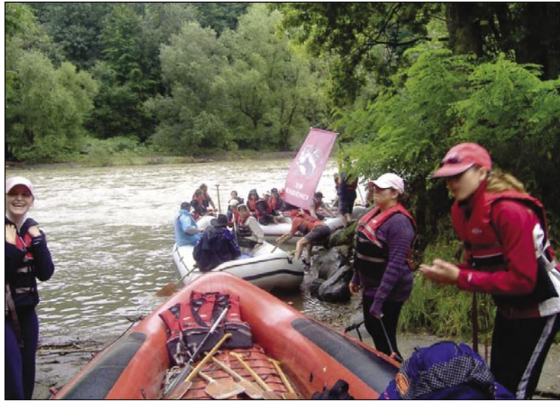
Začetek spusta v Murecku v Avstriji je bil poln pričakovanj

Okrog pol devete ure zjutraj smo se vkrkali v čolne, ne-navaden občutek, tako sredi