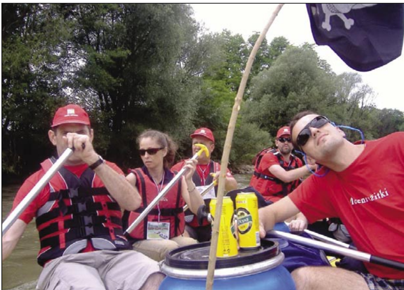
Dokležovska posadka je tudi s pomočjo mojih zaveslajev uspešno krmarila

prometa je bilo zelo malo, potem pa smo zavili pod kostonje ob reki; pot nas je vodila vzdolž Mure, ki je, moji otroški pameti ustrezno, vse preveč hitela, vse prehitro, da bi ji mogla v mislih slediti še izza ovinka, kjer se je izgubila v skrivnost zaviti daljavi. Vedno, ko se spomnim nedeljskih juter in dopoldnevov, se spomnim teh sprehodov: spomladi so zacveteli divji kostonji, njihovi cvetovi so se mi zdeli debele narobe obrnjene ledene sveče, ki so se po čudnem naključju znašle v zelenih krošnjah dreves; pod njimi pa klopce, pobarvane v rdeče in zeleno, mislim, da