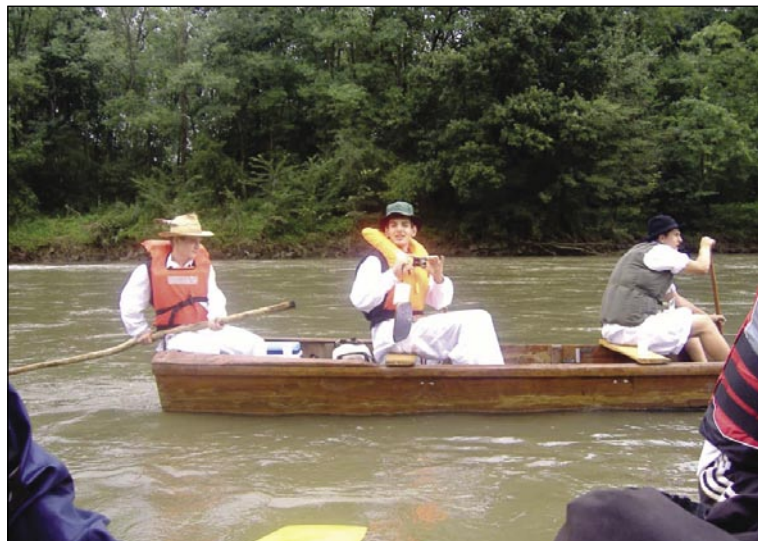
Kolegi Hrvati v narodnih nošah in starinskem murskem plovilu

Mure opazovati levi in desni breg hkrati, človek res nima velikokrat te priložnosti, spontano se te polastijo domovinska čustva, ki se mešajo z občutki kozmopolitstva, saj so bili prvi dan spusta naši družabniki tudi Hrvati in Avstrijci, ki so se kar kosali v izvornosti plovil. Res, da je bilo tistih arhaičnih, takšnih, ki so bila nekoč značilna za ta del Mure, bolj malo, vendar je bilo kar nekaj lesenih, značilno murskih, nesodobnih ob-