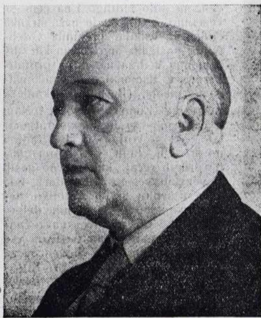
Dr. Korošec Anton, voditeo slovenskoga naroda.

je mela pretežno većino naroda za sebov v celoj Sloveniji, tüdi v Slovenskoj krajini. Prvejši tak zvani „narodni“, „nacionalni“ vlastodršci so toga junaka slovenskoga naroda zaprli i Slovensko ljudsko stranko razpüstili. Sloboščina je tužno povescila glavo pod njihovim ravnanjom i si je zakrila oči. Ne mogla gledati krivice, ki se je s podmetanimi petami šetala med narodom, v rokaj pa nosila meč, šteri je rezao obleko za oblekov dol ž nje. I čakala je. I vüpala se. I ne se vkaniła. Okovi so razpočili z nog sloboščine. Hvar je narodi vrno junaka,