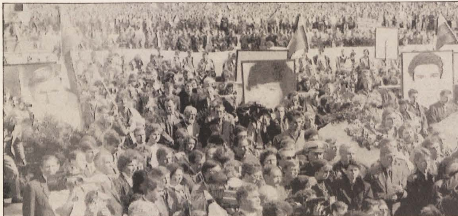
Skoraj milijon ljudi se je udeležilo pogreba treh mladih fantov, ki so s svojimi telesi skušali preprečiti napad tankov na ruski parlament

Pomembno, toda še vedno odprto vprašanje za prihodnost Evrope pa ostaja usoda Jugoslavije. Po zaostitvi mednarodnih spopadov na Hrvaškem se postavlja vprašanje, ali bo konzervativni del te prav tako razpadajoče države doletela usoda po sovjetskem zgledu.