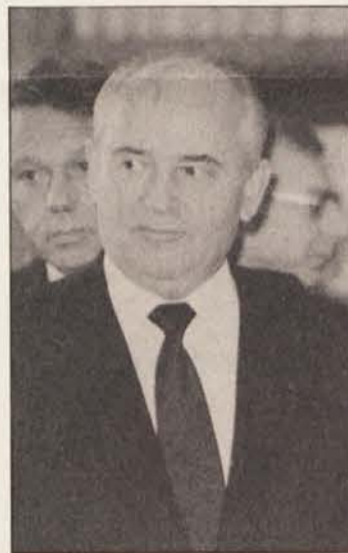
Mihail Gorbačov se je sicer vrnil na položaj državnega predsednika SZ, njegova politična usoda pa je povsem nejasna

Še nekaj besed o usodi „osmerice“ in drugih, v puč vpletenih osebnosti: Sedem