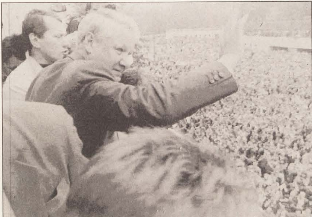
Novi močni mož v Sovjetski zvezi: ruski predsednik Boris Jelcin na zborovanju pred „Belo hišo“ v Moskvi

Usoda Mihaila Gorbačova je po agresivnem, deloma celo poniževalnem in tudi nedemokratskem postopanju novega močnega moža v Rusiji in Sovjetski zvezi povsem negotova. Toda Gorbačov, ki je v soboto zvečer odstopil kot generalni sekretar KP SZ in ukazal razpustitev njenega Centralnega komiteja ter konfiskacijo par-