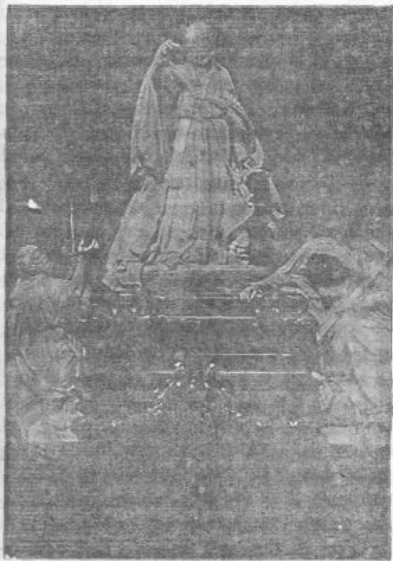
Spomenik Leona XIII. v Lateranu.

Iz pariškega semenišča jim je takoj pisal in jih tolažil. Toda za uboge stariše je bila ta žrtev tako velika, da se kar niso mogli potolažiti. Nazadnje so se seveda morali vdati. Njihov sin pa se je z novo vnemo