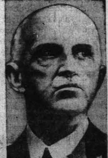
Italijanski kralj, o katerem se se širile govorice, je te dni odstopil. Višeti je potr in žalosten.