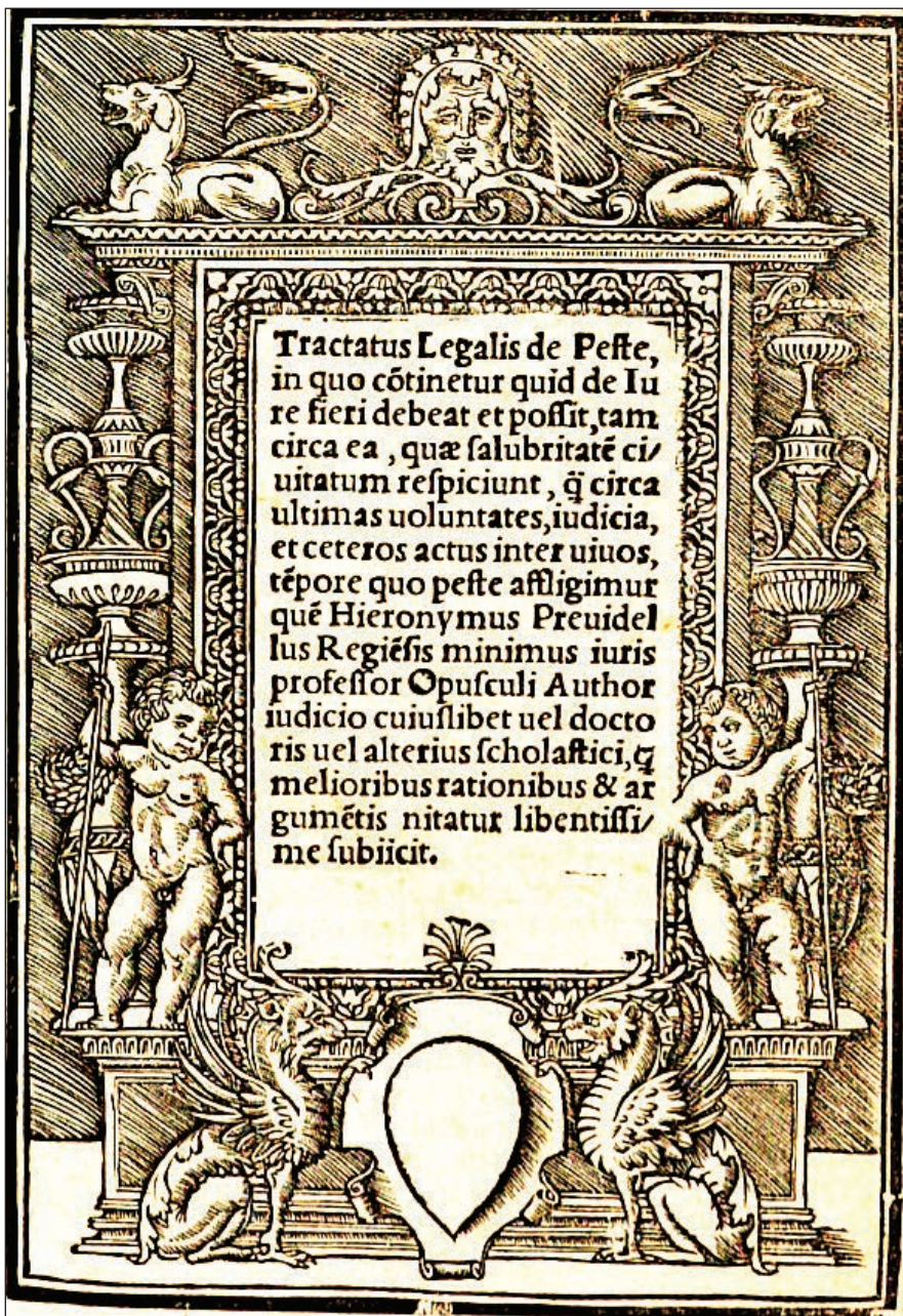
Slika 2: Girolamo Previdelli: Tractatus legalis de peste (1524).