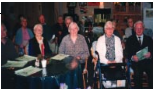
DOM POČITKA MATERE ROMANE Slovenski dom za ostarele 11-15 A'Beckett Street KEW VIC 3101