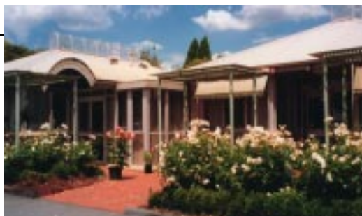
MOTHER ROMANA HOME Slovenian Hostel for the Aged Phone: 03 9853 1054 Fax: 03 9855 0811

Dom počitka matere Romane je ustanova slovenskega misijona v Melbournu, ki nudi bivanje v domačem okolju ostarelim in vsem, ki potrebujejo nego. Prijazna in topla soba, domača hrana, vesela družba, popolna zdravniška nega in celotna oskrba je samo del tega, kar boste našli v domu počitka ob cerkvi v Kew.