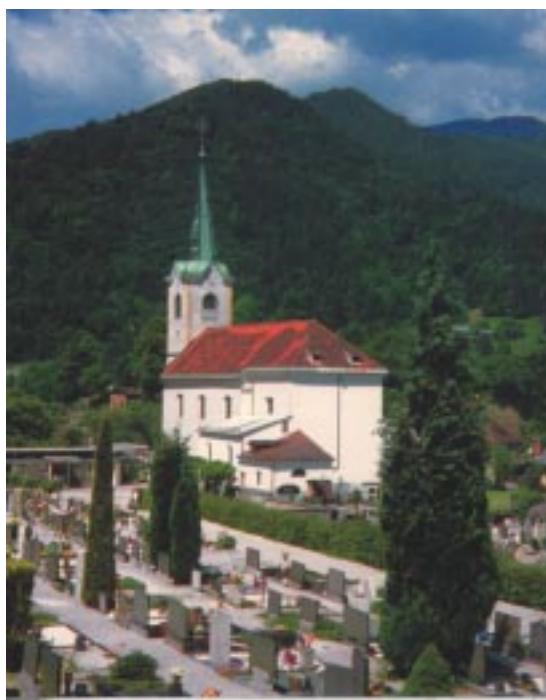
Božja njiva ob župnijski cerkvi v Trziču.