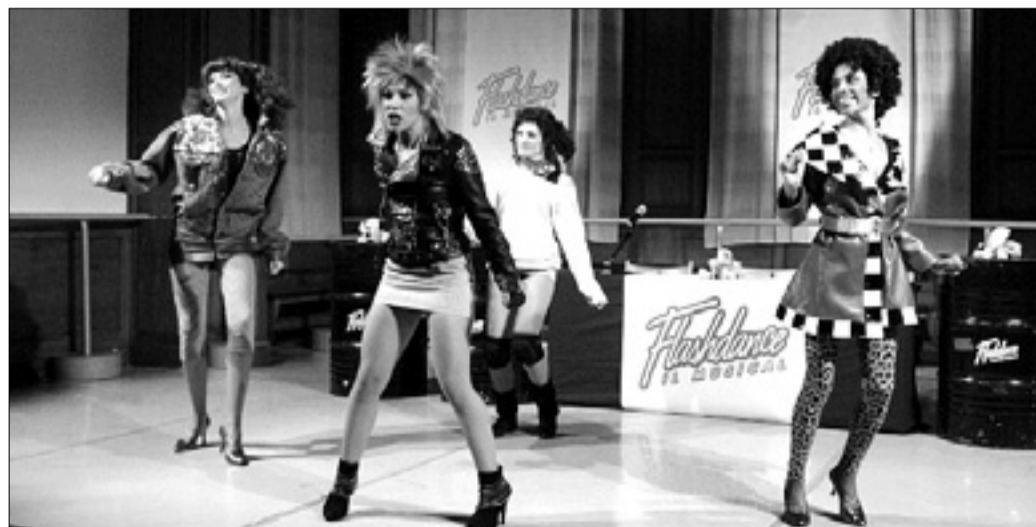
Včeraj so tudi pokazali, kako je zastavljen muzikal