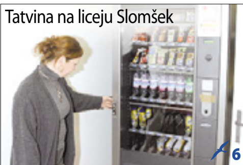
Tatvina na liceju Slomšek