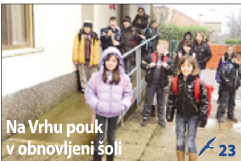
Na Vrhu pouk v obnovljeni šoli