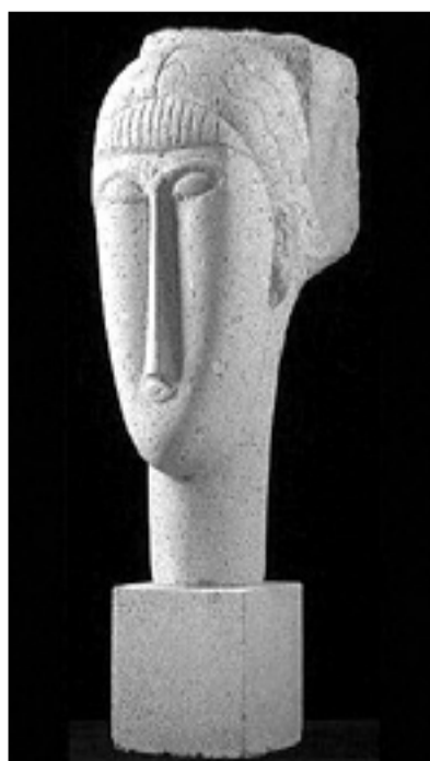
Amedeo Modigliani, Kamnita glava

Umetnik velja za tragični lik bohema v umetnosti. Umrl je v Parizu. Podlegel je tuberkulozi, povsem na koncu z močmi, zgaran in uničen zaradi pretiranega uživanja narkotikov in alkohola, star komaj 35 let. Čeprav je Modigliani v Parizu, kjer je živel med letoma 1906 in 1920 srečeval s predstavniki avantgarde, je pa razvil popolnoma samosvoj slog.