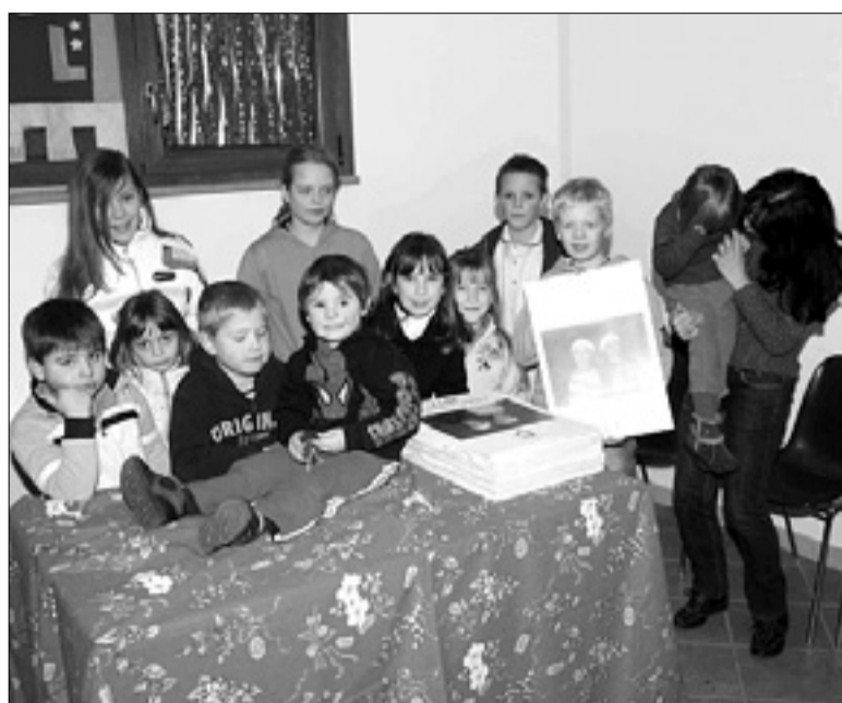
Otroci s koledarjem društva Kras