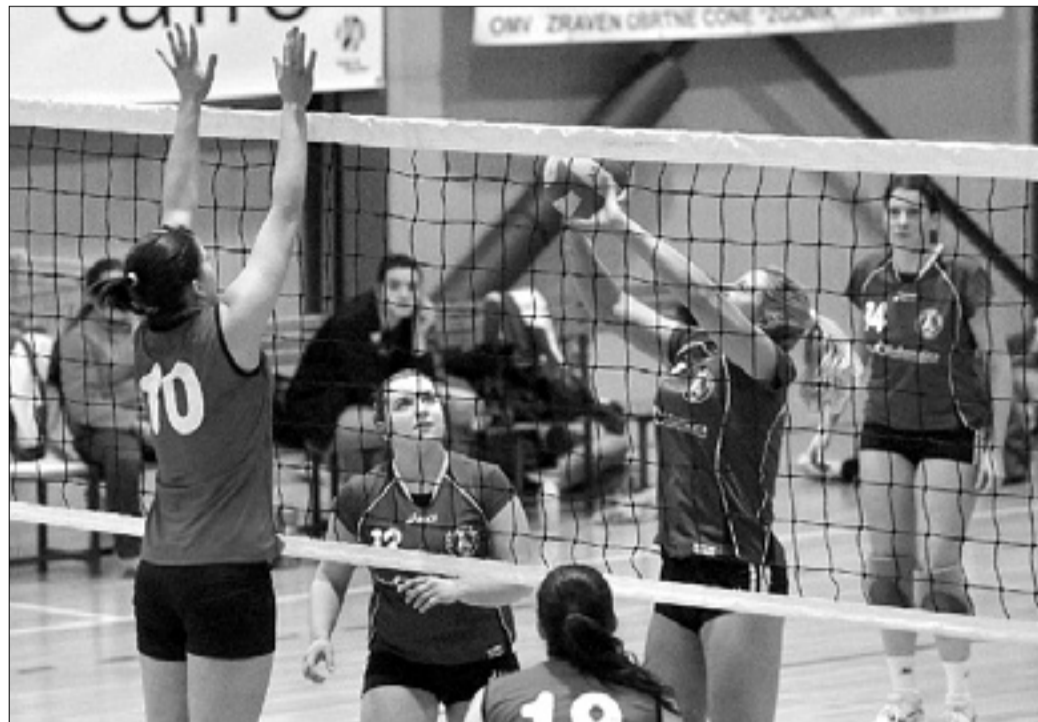
Z derbija 1. ženske divizije Sloga - Breg

Čeprav so v goriškem taboru pričakovali zahtevno in napeto tekmo, tokrat ni bilo tako, saj so domačini Hammer, enega glavnih tekmecev v boju za naslov, povsem nadigrali. Olympia je bi-