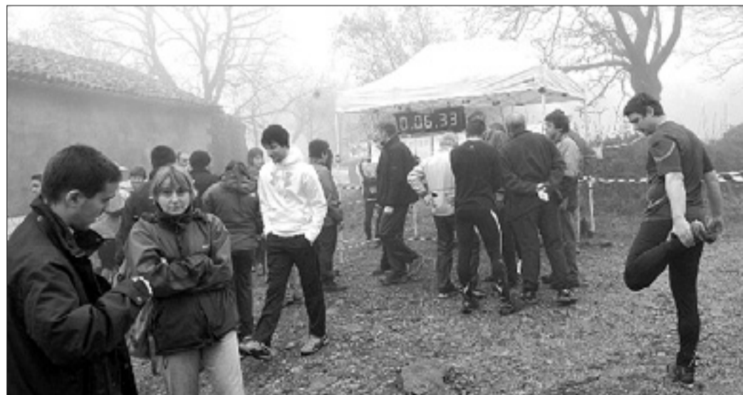
V Gropadi je bilo v nedeljo na startu zelo živahno