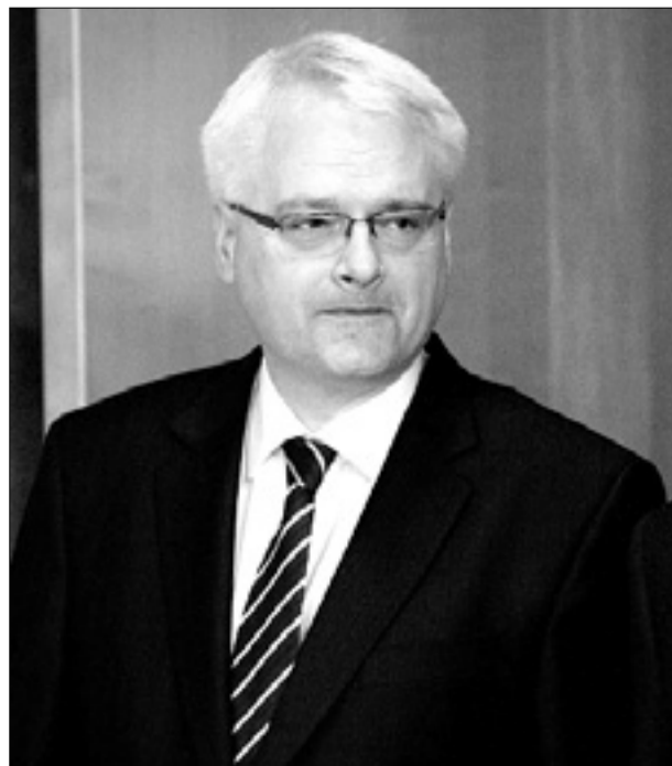
Hrvaški predsednik Ivo Josipović

Izrazil je tudi zadovoljstvo z izidi javnomnenjske raziskave, v kateri so mu dodelili oceno "prav dobro" in kjer je prejel podporo 87 odstotkov državljanov. Na novinarsko pripombo, da nekatere njegove poteze niso naletele na podporo državljanov, kot so izjave o morebitnem umiku medsebojnih tožb za genocid proti Srbiji ali obisk v Republiki srbski, je Josipović dejal, da gre za manjšino državljanov. "Ko gre za 39 odstotkov tistih, ki tega ne odobravajo, je to odlični izid, glede na to, da gre za zelo občutljive poteze po težki zgodovini, ki smo je imeli," je dejal Josipović.