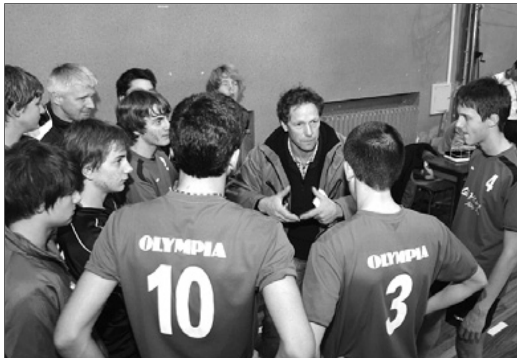
Ekipa Olympie under 16 premočno vodi v deželnem prvenstvu, tokrat pa je prepustila točko Torriani

Vrstni red: Fincantieri Azzurra 24, Millenium 21, Ronchi 17, Mossa 15, Torriana 13, Staranzano 11, Cormons 10, Soča 6, Lucinico 2, Fincantieri bianca 1.