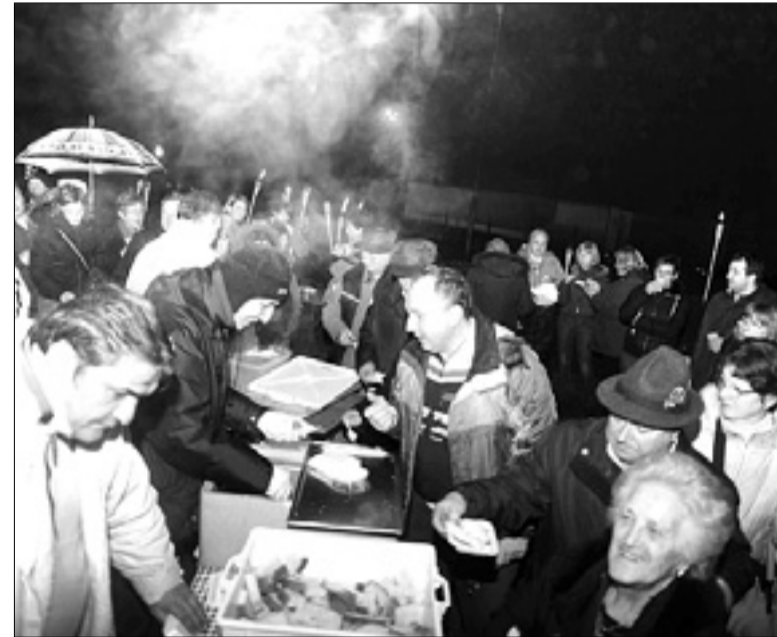
Ob zaključku pohoda je bilo poskrbljeno tudi za prigrizek