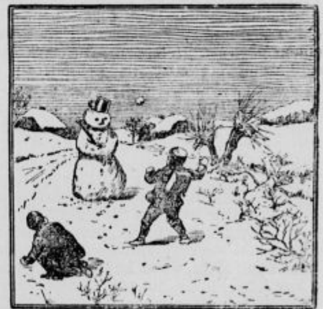
Kje je tretji napadalec?

g Ljubljanski živinski sejem 2. t. m. Za kg žive teže se je plačevalo: voli debeli Din 10.25—10.50, voli rejeni Din 9.50—10, vpreženi voli Din 8.50—9.50, krave rejene 7—8 Din, krave klobasarice Din 4.50—6, teleta debela Din 9 do 9.50, teleta težja debela Din 14—15, teleta lažja rejena Din 13 do 13.50, teleta zaklana Din 18 do 19, prašiči peršutarji Din 14.50 do 15, prašiči debeli Din 15.50 do 16.25, banaški špeharji Din 16 do 16.50, prašiči zaklani Din 17 do 19. — Cene pri goveji živini in teletih so ostale neizpremenjene. Le za debelimi prašiči je več povpraševanja in se to blago sedaj lažje prodaja. Kakor je pričakovati, bodo ostale cene tudi naprej neizpremenjene.