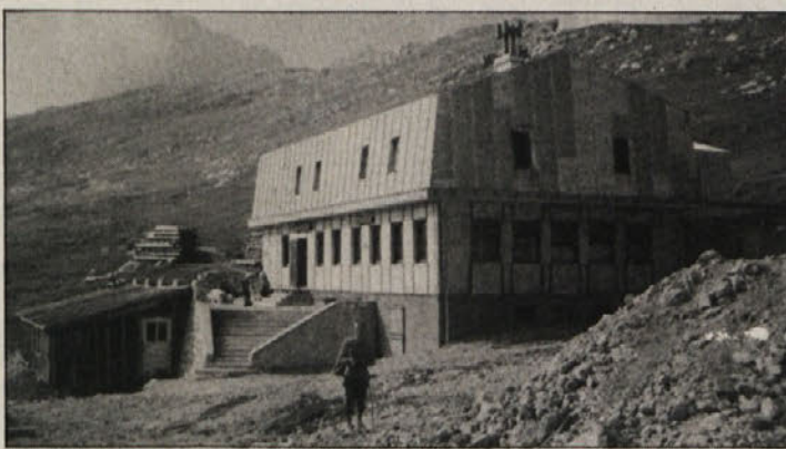
Moderna in prostorna Kamniška koča