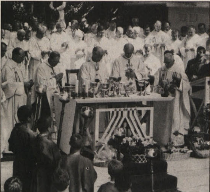
Letošnjega romarskega srečanja treh dežel na Rakovniku pri Ljubljani – mašo so darovali škofje iz Celovca, Vidma in Ljubljane (slika) – se je udeležilo nad pet tisoč vernikov.

Bogoslužje je bilo petjezično, kot zastopnika Koroške sta ga sooblikovala cerkvena zborna iz Kazaz in Šentpetra na Vašinjah.