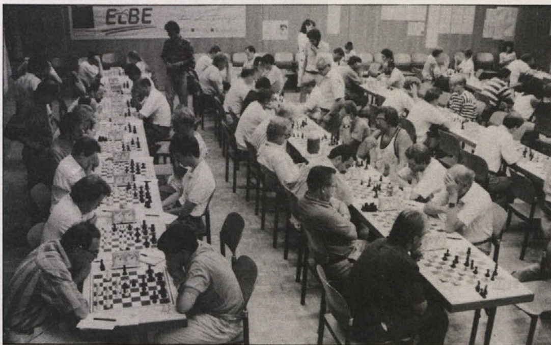
126 šahistov in šahistk iz sedmih držav se je udeležilo letošnjega 8. mednarodnega šahovskega turnirja v Ločah ob Baškem jezeru.