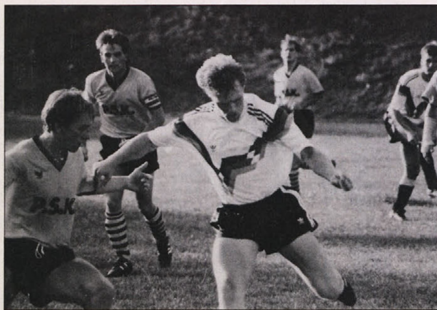
Dvoboji v sredini, podaje z glavo in odbijanje žoge v stran so bile značilnosti tekme Bilčovs - Žitara vas.