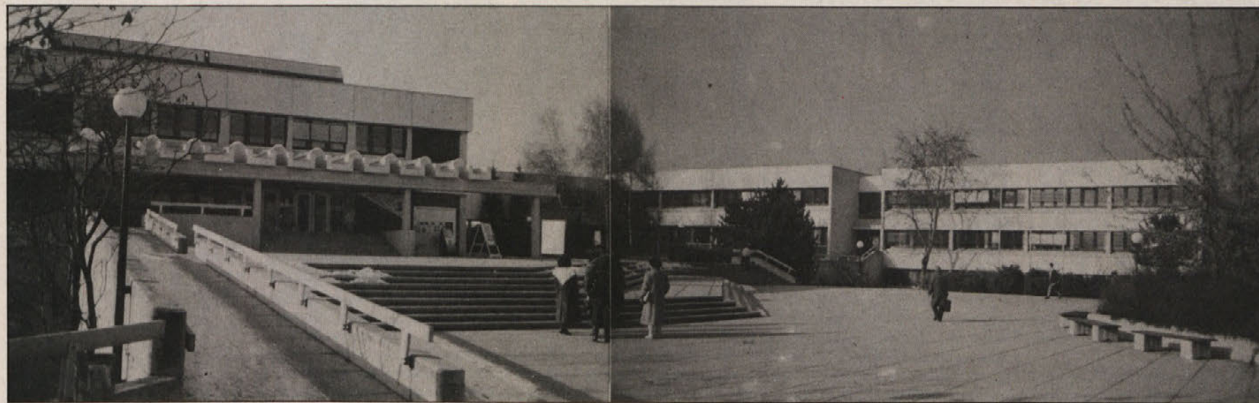
Bo celovška Univerza za izobraževalne vede zdržala do naslednjega tisočletja v svoji doslejšnji zunanji in notranji podobi?

Zvedel pa sem že za primere, da so maturanti izjavili, češ da v Celovcu ne bodo začeli študija, ker ne vedo, ali ga bodo tu potem tudi lahko zaključili. Povsem jasno je, da sedanja diskusija o bodočnosti celovške univerze morebitne študente odvrča in jih usmerja v Gradec ali na Dunaj.