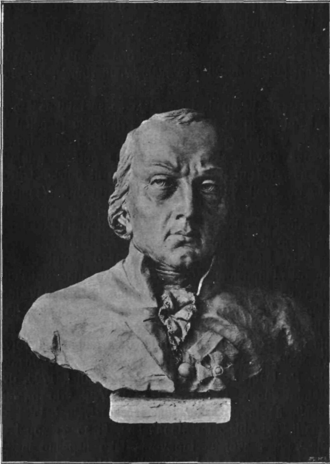
Vegov kip na realki v Idriji.

Cesarski bombe mečejo, se Turki z grada vlečejo.