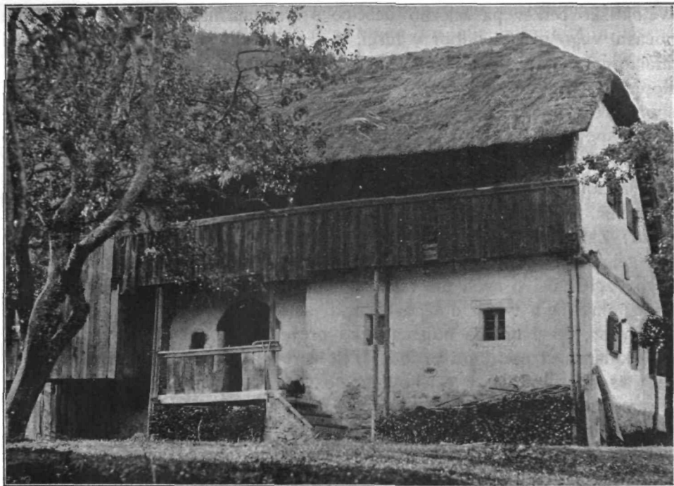
Vegova rojstna hiša.