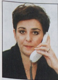
Piše: Lidija Jerkič