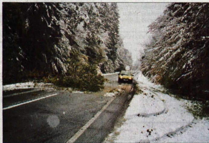
Na Jeprci: sneg je lomil tudi drevje.

snežiti, z zimskimi pnevmatikami opremljena približno petina vozil. "Večina vozil je bila še brez zimske opreme. Vozniki so zato vozili ne samo previdno, ampak že kar pretirano boječe. Ker so zraven zelo previdno vozili tudi tovornjakarji, so na cestah, predvsem na podvinskem