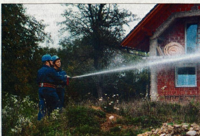
V Dornicah so imele vajo članice iz GZ Vodice.

Vodice - Na območju Gasilske zveze Vodice sta bili doslej v mesecu požarne varnosti že vaja članic iz gasilskih društev v Dornicah in gasilski avtoraly na območju celotne zveze. V