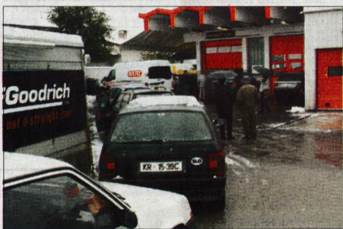
Vulkanizerji so imeli v zadnjih dneh obilico dela...

V petek dopoldne so o tem zgovorno pričale dolge kolone pred vulkanizerskimi servisi; na zamenjavo gum je bilo treba čakati tudi po dve uri. Pri enem večjih