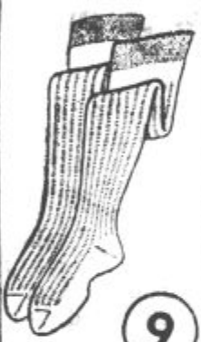
ZORA Trajne in močne nogavice iz egipatskega bombaža, stanejo Din 9'.