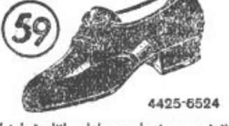
4425-6524 V teh čevljih udobnega kroja se počuti Vaša noga prav prijetno. Izdelani so iz črnega dihtina z apertnim okrasom iz laka.