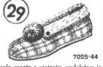
7025-44 Tople copate z usnjenim podplatom in filcom. Obrobjene svilo in okrašene z lepo kokardo. Potrebne vsaki gospodinjli.