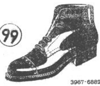
3967-68822 Moški čevlji iz boksa z usnjenimi notranjki in z močnim nepromočljivim in neraztrgljivim gumijastim podplatom. Vsled svoje trpežnosti ti čevlji prinesejo vsak štopac, a po svoji obliki lahko nadomeščajo prozračne čevlje.