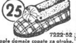
7222-52 Tople domače copate za otroke, izdelane iz volnenega dubla z usnjenim podplatom in toplim medpodplatom. Okrašeni so z bogatim žopkom. Stanejo samo Din 25'.