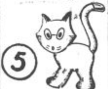
Maček Marko lisec stari deci Vaši veselja pravi.

NAŠA OBUTEV IZ USNJA IN GUME OHRANILA VAM BO ZDRAVLJE IN PRIHRANILA DENAR