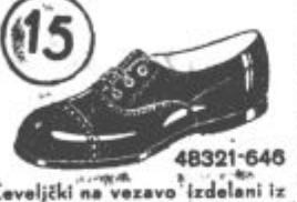
48321-646 Čevljički na vezavo izdelani iz lakirane gume z močnim, gumijastim podplatom. Ne prepustajo vode in stanejo samo Din 15' 19' in 25'.