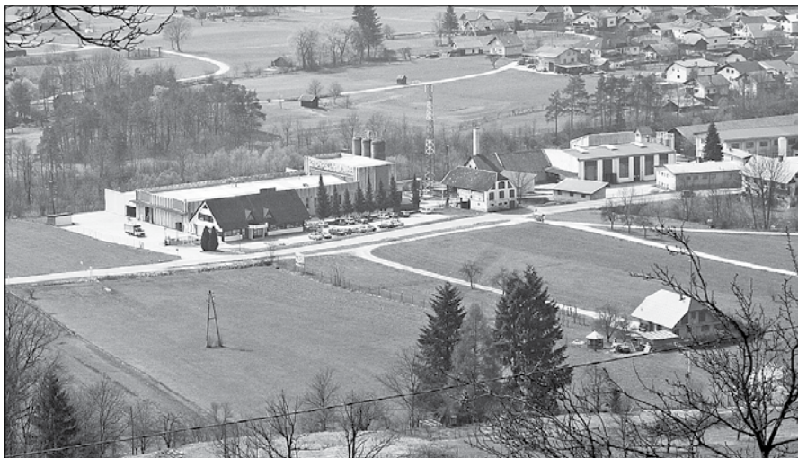
Na lokaciji Cinkarne v Mozirju pregled ni pokazal vplivov na okolje.