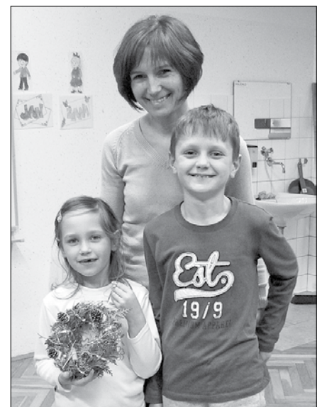
Venček smo izdelali vsi skupaj.

Po kratkem kulturnem programu, ki so ga starši nagradili s ploskanjem, smo se lotili dela. Starši so ovijali obroče s cipreso, učenci pa so jim nosili vse, kar so pripravili za izdelavo venčk-