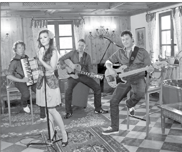
Skupina Črna mačka ob nastupu v Logarski dolin

vodja srečanja Ivana Žvipelj. Ob čestitkah avtorjem je Podgoršek izrazil željo, da druženje ne izzveni kot tekmovanje temveč kot kulturni dogodek, kjer bi drug drugemu lahko pri-