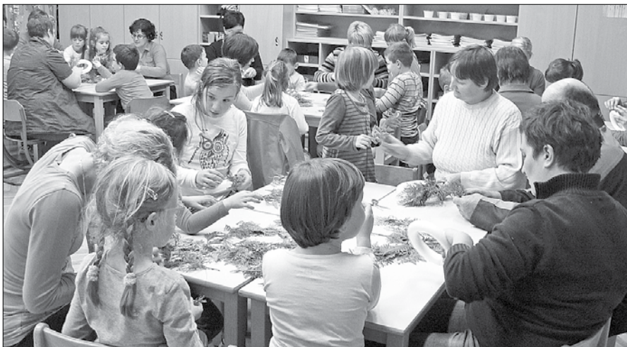
Otroci so uživali v izdelovanju venčkov s starši.

Čas neizmerno beži. Komaj smo vstopili v novo šolsko leto, že je tu december. Prvošolci so se že veliko naučili, zato smo se odločili, da v šolo povabijo svoje starše. Pripravili smo kratek kulturni program, s katerim smo pokazali, da se v šoli poleg igranja tudi učimo. Nabrali smo macesnove storžke in vejice, jih posrebrili in pripravili za delavnico s starši. Učiteljica Ana je nabra-