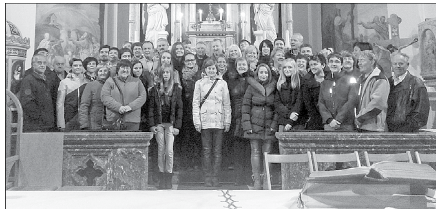
Združeni zbori iz Gornjega Grada, Bočne in Nove Štiffe so letos prepevali na več dogodkih.