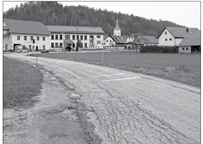
Ena izmed slabših cest v dolini pelje skozi Šmartno ob Dreti.

nih in regionalnih cest je ocenjenih z le po eno zvezdico. Med najslabšimi odseki so glavna cesta Logatec-Idrinja-Tolmin, cesta Novo me-