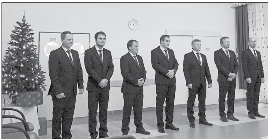
Člani okteta Žetev so bili prvi decembrski gostje, ki so razveselili stanovalce.