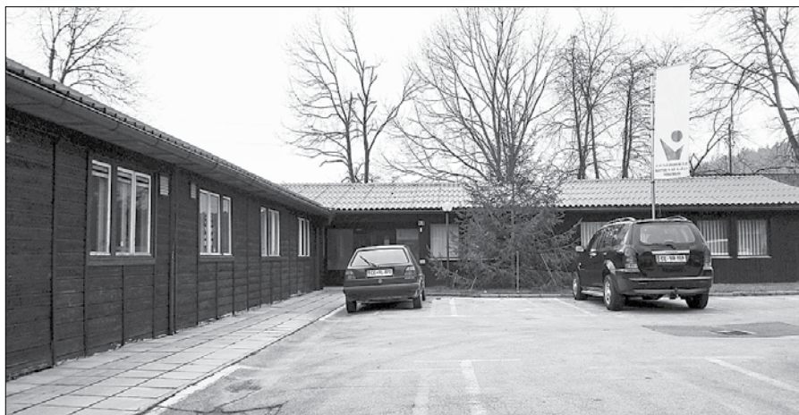
JP Komunala Mozirje želi na parceli, kjer je sedež podjetja, zgraditi novo poslovno stavbo, a se zapleta pri denarju.