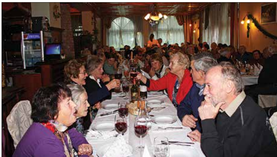
Druženje nazarskih upokojencev je potekalo v sproščenem vzdušju.