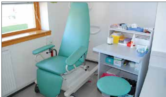
V Zgornjesavinjskem zdravstvenem domu jim je uspelo preurediti in povečati prostore laboratorija.

ko bolj zadovoljni, da jim je v tem letu poleg nakupa zdravstvenega vozila uspelo preurediti in povečati prostore laboratorija, za katerega so tudi dobili dovoljenje.