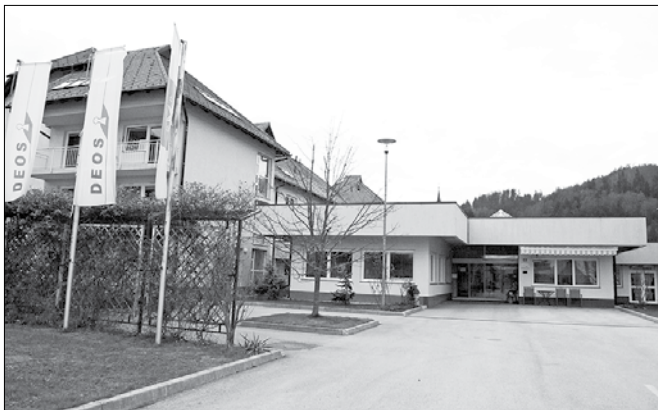
Preko zadnjega vikenda v novembru se je v Centru starejših Gornji Grad zgodil drzen rop. Storilci so iz trezorja, v katerem so stanovalci centra hranili denar, odnesli kar 24.000 evrov.

šani za svoj denar. DEOS, ki med drugim vodi nekaj domov za starejše po Sloveniji, ima vso lastnino stanovalcev, shranjeno v trezorju, zavarovano. Že v torek so stanoval-