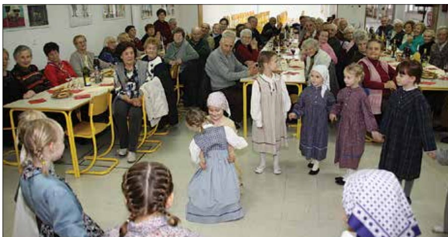
Sproščeno in veselo vzdušje so popestrile deklice iz Folklorne skupine Mlinček.