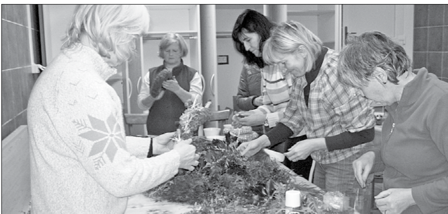
Adventne venčke je skupaj s cvetličarko izdelovalo osem udeleženek.