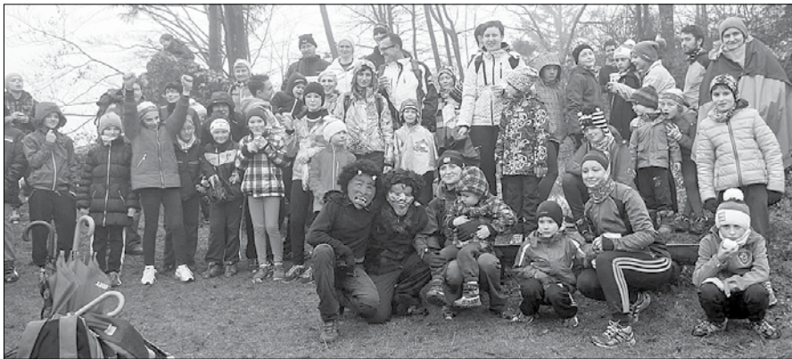
Nekaj udeležencev Miklavževega teka