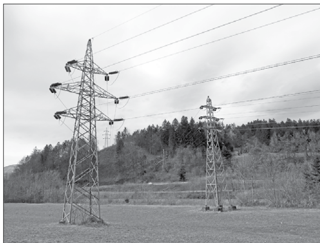
Februarski žled je pokazal, da zdajšnji sistemi niso odporni in ne zagotavljajo zelene zanesljivosti dobave električne energije, zato bodo v podjetju Elektro Celje umestili nove distribucijske vode v zemeljski izvedbi na relaciji Nazarje-Ljubno ob Savinji.

Na območju naše doline se v bližnji prihodnosti predvideva umestitev treh takšnih distribucijskih vodov. Distribucijski vodi so geografsko predvideni od Nazarij do Ljubnega ob Savinji. V zemljo se bodo položili trije sistemi glavnega voda. Prva dva bosta v glavnem namenjena napajanju Ljubnega ter