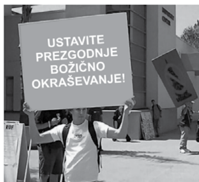
Že poleti je treba misliti na te reči.

Menda sem spet sesula internet. Pa samo listo želja sem poslala Božičku. Menda lahko par stostranski wordov dokument naredi precejšnjo škodo, če ga pomotoma pošleš vsem kontaktom. Moram dopisati na listo želja še navodila za take internetne zadeve. Ops, spet sem vsem poslala.