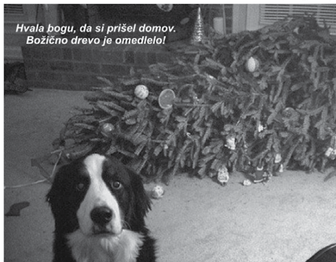
Hvala bogu, da si prišel domov. Božično drevo je omedlelo!

Kot davkoplačevalci smo vsi preobremenjeni. Edina rešitev nam je, da vsi začnemo živeti na veliki nogi od davkoplačevalskega denarja, samo vsak si mora najti svojo novo državo.