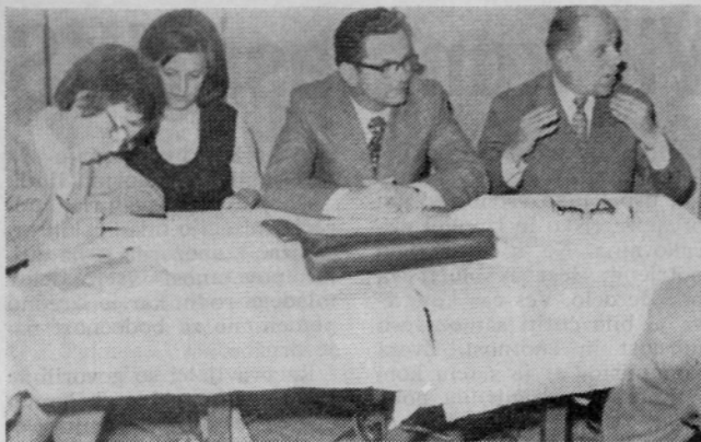
Delovno predsedstvo na občnem zboru.