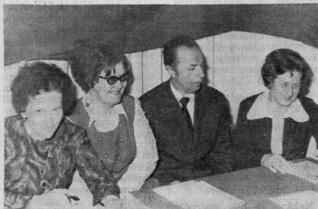
Oplemenitilnica in konfekcija sta imeli skupno volišče

Med delegati je pet mladih, kar predstavlja 22,8 % ter 7 članov ZK (39 %).