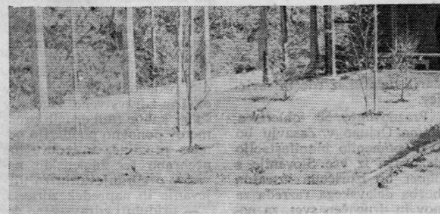
Okrog tovarne so v mesecu aprilu posadili okrasna drevesca

Omeniti je še treba, da se je vsak posameznik — udeleženec ekskurzije lahko prepričal o velikem napredu te tovarne ter veliki spremembi, ki je nastala v zadnjih letih.