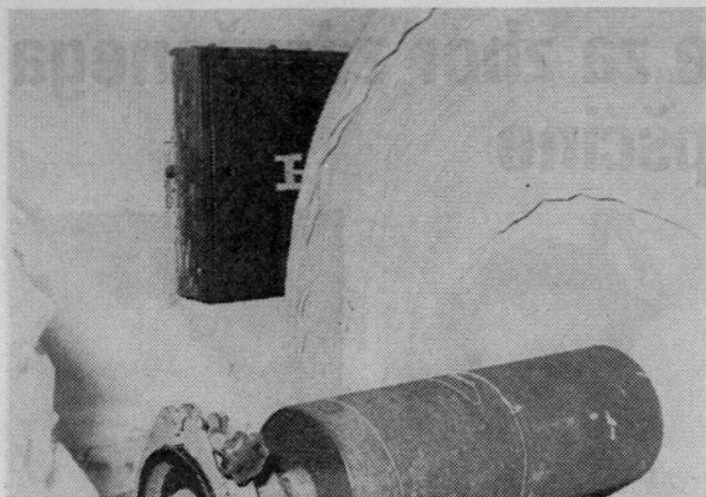
Ne zalagaj dohoda k hidrantu...