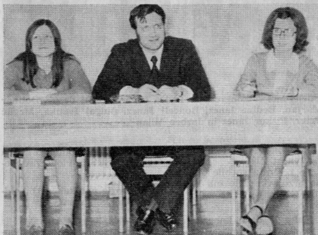
Volilna komisija V. DE in skupnih služb

Iz rezultatov je razvidno, da smo za delegate izvolili 11 moških (61 %) in 7 žensk (39 %).