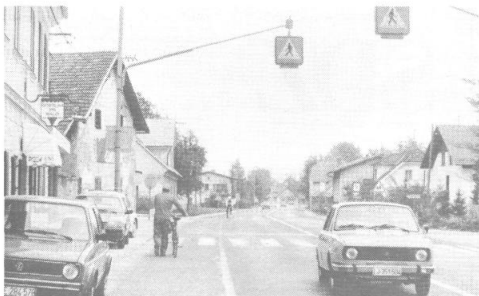
Dolenjska s svojimi prometnimi pastmi in nevarnostmi že kar kliče po novi preobliki

Dovoljenje za postavitve kioska pridobi interesent, ko na sekretariatu za urejanje prostora in varstvo okolja občine vloži prošnjo za postavitve kioska, opremljeno s soglasjem lastnika zemljišča, mestnega sekretariata za promet ter soglasjem sekretariata za planiranje za uporabo prostora. Že omenjeni sekretariat za urejanje prostora pa na osnovi dokumentacije izda dovoljenje v skladu s prostorsko izvedbenimi akti. Zemljišča, ki so v družbeni lasti daje v zakup Sklad stavbnih zemljišč mesta Ljubljane in sicer za dobo enega leta z možnostjo podaljšanja. Interesent je dolžan za uporabljen zemljišča plačati davek in prispevek za uporabo mestnega zemljišča, Komunalne instalacije se običajno izvedejo na račun uporabnika kioska. V celotni postopek pa so seveda vključene tudi inšpekcijske službe, ki pa tudi sankcionirajo nepravilnosti pri obratovanju.