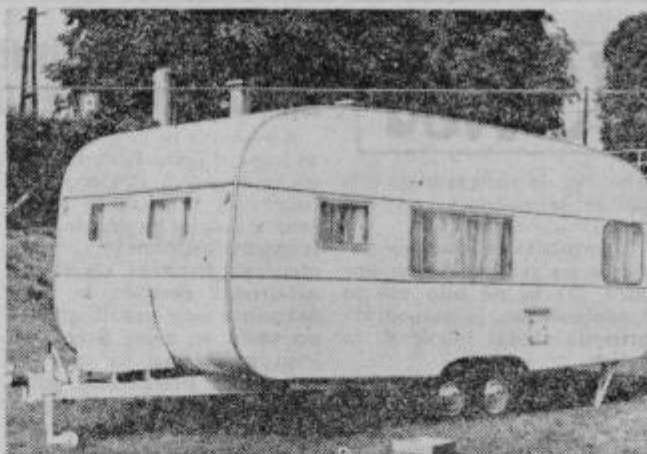
V zobozdravstveno ambulanto preurejena turistična prikolica

Donkor je dobil lažje telesne poškodbe in je odšel v ptujsko bolnišnico. Na avtomobilu je nekaj nad 2 milijona SD materialne škode. jr