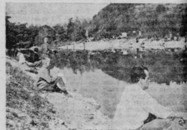
Pogled na tekmovalni prostor v Orešju

Vsi tekmovalci so dobili praktična darila, ki so jih prispevali: Mercator, PE Pranonija Ptuj, Petovia, Ptuj Slovenske gorice, Ptuj, T. Izbira, Ptuj, Haloški bist, Perutnina Ptuj, TGA Bori Kidrič, Kidričevo in Kred na banka.