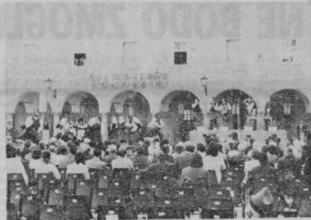
Na minoritskem dvorišču so odmevali plesni takti in domače pesmi

Folklorno društvo Ptuj je pripravilo v nedeljo na dvorišču minoritskega samostana v Ptujem uspešno revijo ljudskih plesov, ki bo postala poslednja tradicionalna ptujška prireditev. V zanimivem sporedu ljudskih plesov so nastopile plesne skupine iz Markovec, Cirkovec, Petrijanca, Beltincev in Nedeljske. Vmes so nastopili tudi domači godci iz Slovenskih goric in Haloz.