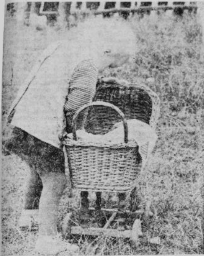
Tako je, če imajo otroci otroke. Nekateri prave žive otročičke, ki včasih prav nič ne ubogajo, drugi pa take male igračke, ki nikoli ne nagajajo, le včasih malo zajokajo, spijo, če jih položiš v posteljo in so sploh prava podoba idealnega otroka. Naša mala mamica se skrbno sklanja nad hčerkico v vozičku in ji prigovarja, naj vendar že zaspj in sanja lepe sanje. S. S.