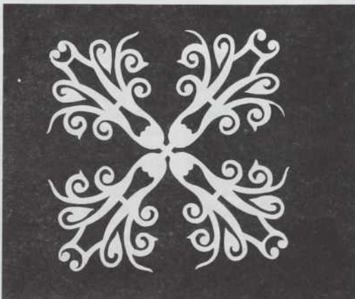
Evgen Titan, prof.: KLIC POMLADI / Izrezanka - 1995/