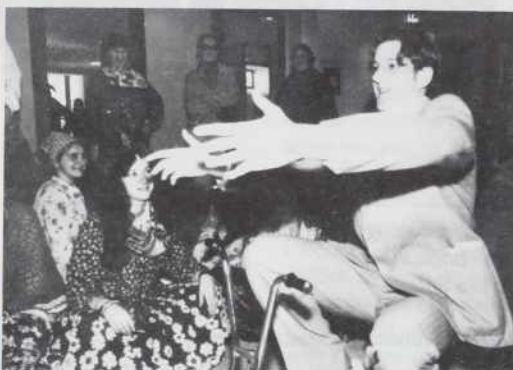
4. razred je uprizoril sceno iz romske vasi.