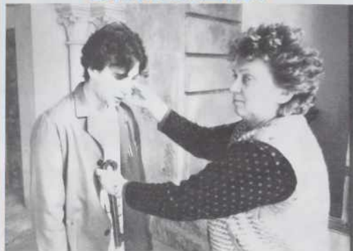
Predajam ti ključ šole in odgovornost.