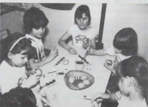
Tudi števanovski malčki se pripravljajo na veliko noč.