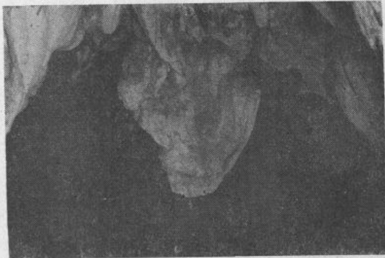
»Veliko srce« v Hudi luknji