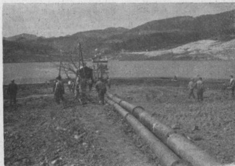
Pospravljanje terena na katerem so preizkusili mornariške sposobnosti

Vendar ni samo naloga organizacije ZK vzgajati mladino v naprednem duhu, ampak je to stvar vseh organov delavskega in družbenega samoupravljanja. Zavedati se moramo, da mladina dorasča in da homo čez čas prav pri njej izbrali kader za upravljanje in da je treba sedaj napeti vse sile, da jo že sedaj vzgojimo v napredne in sposobne graditelje naše družbene stvarnosti, zgraditi mladino, ki bo po svojih sposobnostih bogata izkušnja in voljna dela. -fer-