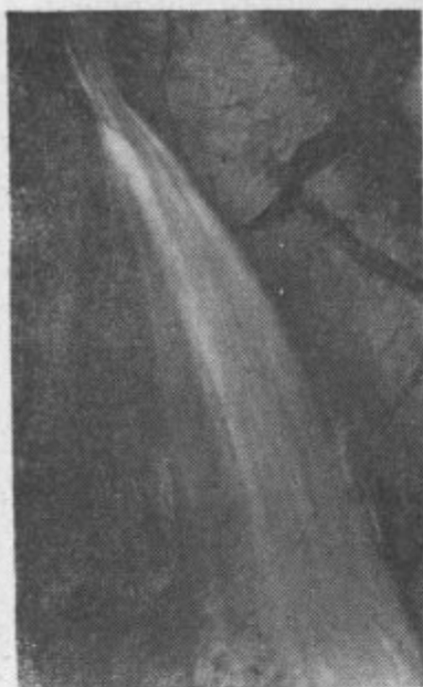
»Slap« v Hudi luknji

Če prometni miličnik ugotovi, da mopedist dovoljenja sploh nima ali da napravi prometni prekršek ali vozi moped v vinjenem stanju ga prijavi sodniku za prekrške, ki ga lahko z ozirom na veličino prekrška kaznuje z denarno kaznijo nad 500 do 20.000 dinarjev. (Nadaljevanje na zadnji strani)