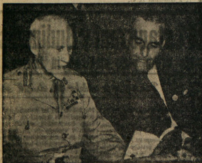
Gen. Stettin se razgovarja v S. Franciscu z ministrom zunanjih zadev južne Afrike

Razpravljajo o predlogu za politično delovanje in varnost glavne skupščine - Postopke Sveta varnosti za proračun neopozlaj