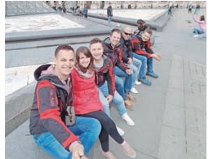
Člani Ansambla Galop so gostovali pri slovenskih izseljencih v Franciji.