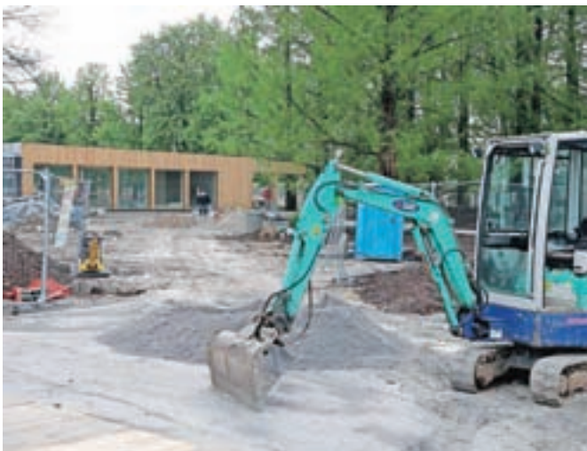
Nov vstopni objekt je zgrajen, delavci te dni urejajo še okolico.

V Arboretumu se pospešeno pripravljajo tudi na regionalni kongres Svetovne zveze društev ljubiteljev vrtnic, ki ga bo Slovenija gostila med 11. in 14. junijem, dva dni se bodo »vrtničarji« zadrževali v Arboretumu, kjer si bodo lahko ogledali že skoraj tisoč različnih sort vrtnic.