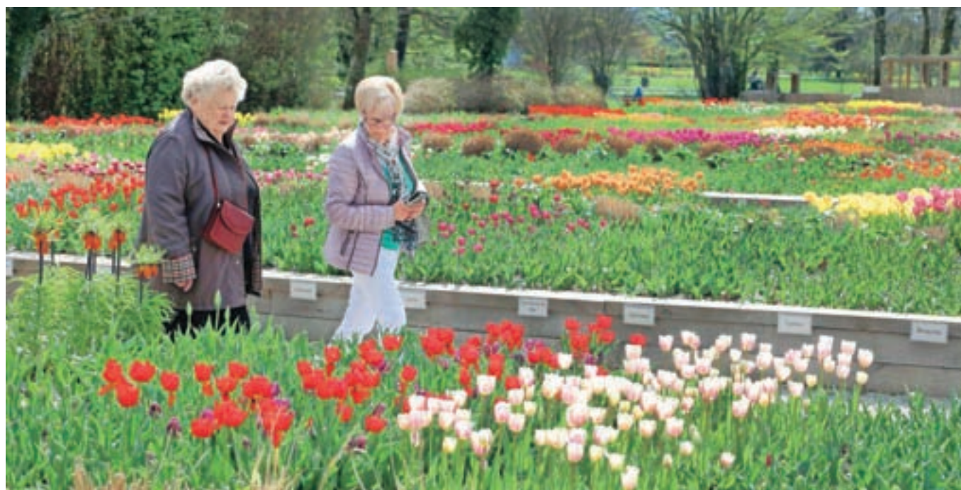
Tulipani bodo v Arboretumu letos cveteli na kar šestih hektarih površin.

V Arboretumu Volčji Potok bodo čez nekaj dni za obiskovalce ponosno odprli nov vstopni objekt, ki bo nadomestil dosedanega – premajhnega in že močno dotrajanega. Pol milijona evrov vredno naložbo so speljali skupaj z ministrstvom za kulturo. V parku je te dni zelo živahno, saj je na ogled že šestindvajseta razstava spomladanskega cvetja.