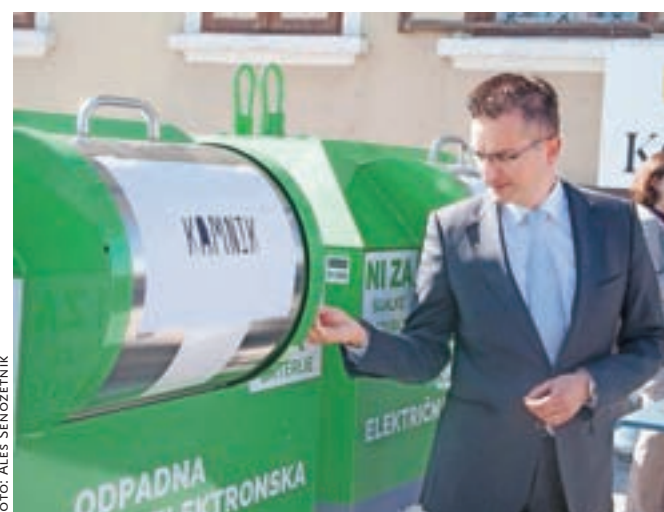
Elektronski odpadki so med nevarnejšimi za okolje, zato je pomembno, da jih zbiramo v zato namenjenih zbiralnikih.

Komenda – Elektronski odpadki in odpadne baterije spadajo med najnevarnejše in najhitreje naraščajoče odpadke. Zato je družba ZEOS z lokalnimi partnerji začela s projektom LIFE Gospodarjenje z e-odpadki, pod sloganom E-cikliraj. Projekt, v okviru katerega so začeli postavljati zbiralnike tovrstnih odpadkov, je podprt z evropskim denarjem in s strani Ministrstva za okolje in prostor. Projektu se je pridružila tudi Občina Kamnik skupaj s podjetjem Publicus. Pretekli teden sta listino o predaji