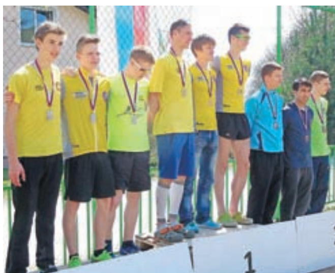
Štafete KGT Papež na stopničkah

Zbrali so se v Eko resortu pod Veliko planino, kjer bo start proge članov (12 km, 1295 m višinske razlike), nato pa so tekli po cesti do Vegrada in naprej, kjer so si pri Bodlajevi domačiji (8,5 km, 1035 m v. r.) ogledali start mladincev in članic. Pri Mickini koči pred Pasjimi pečinami so se že spogledovali z Gradiščem, kjer bo cilj. S starta mladink na Kisovcu (4,5 km, 430 m v. r.) so se tekačem pridružile še mladinke. Mala planina jih je pričakala vsa v vijoličnem razkošju žafrana, nato so tekli mimo Jarškega doma do pastirskega naselja na Veliki planini in cilja na Gradišču (1660 m visoko). Zadovoljni z ogledom in treningom so se z žičnico vrnili v dolino, kjer jih je s svojim gostoljubjem spet sprejela gostilna Pri planinskem orlu.