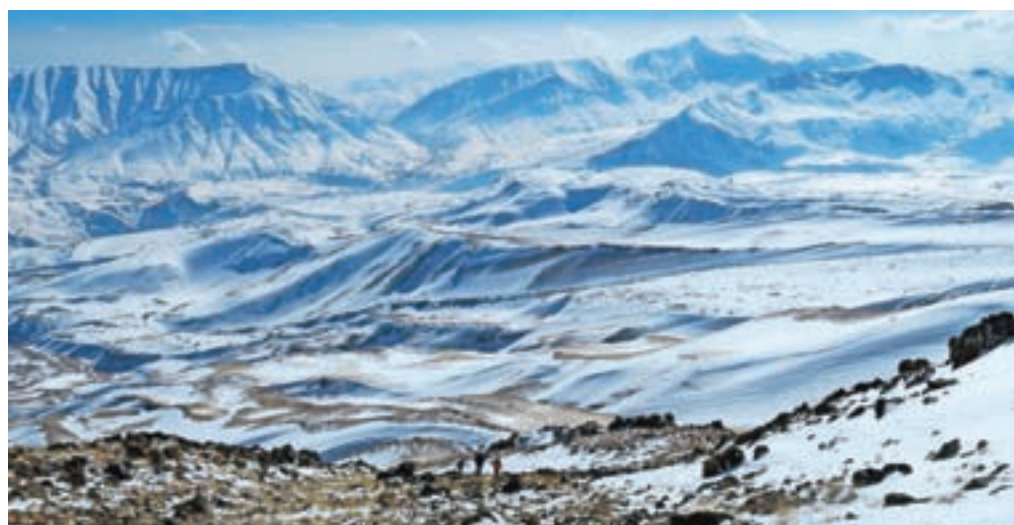
Čudovita pokrajina