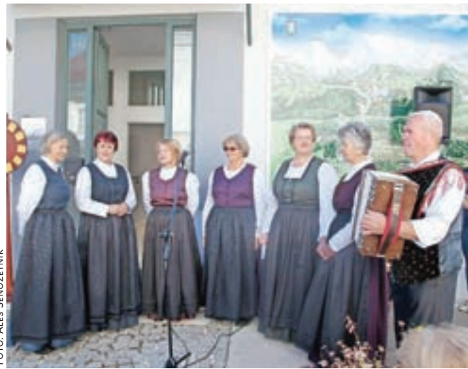
Na prireditvi so zapele tudi Ljudske pevke Predice.