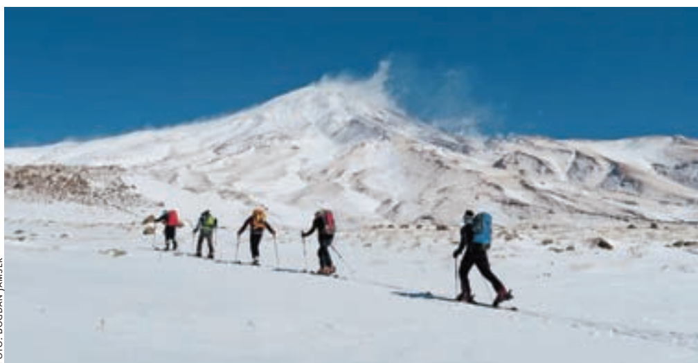
Krenili smo v čudovit, a mrzel dan z nekaj centimetri na novo zapadlega snega.

od Arabcev, govorijo svoj jezik, njihova veja islamizma, to je šiitizem, pa kljub demonizaciji, ki jo nad njim izvaja zahodna propaganda, navzven deluje kar všečno. Ves čas smo se počutili zelo varne, najbolj pa nam je bilo všeč, da je vse, kar smo se dogovorili, tudi zares veljalo, čeprav je bilo marsikaj le ustni dogovor. Ljudje se povsod zelo zanimajo za tujce in so zelo vedoželjni. Težava pa je, da jih malo – in še ti bolj slabo – zna angleški jezik. Promet je povsod zelo gost, v večjih mestih pa je skoraj nepopisna gneča. Kako tudi ne, saj se za en evro dobi kar okoli 13 litrov dizelskega goriva.