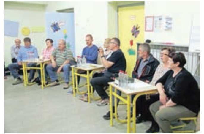
Udeleženci kviza o Tunjicah (od leve proti desni): Sončni rob, Močeradovci in Center