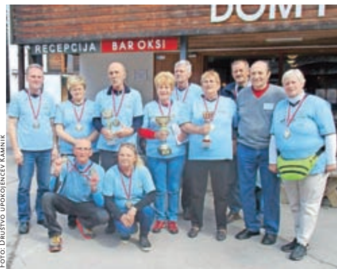
Ženska in moška ekipa Društva upokojencev Kamnik na letošnjih pokrajinskih športnih igrah v Planici

Vedno in povsod poudarjamo, kako zaželena je primerna telesna aktivnost celo življenje. S tem izboljšujemo kakovost življenja in se-