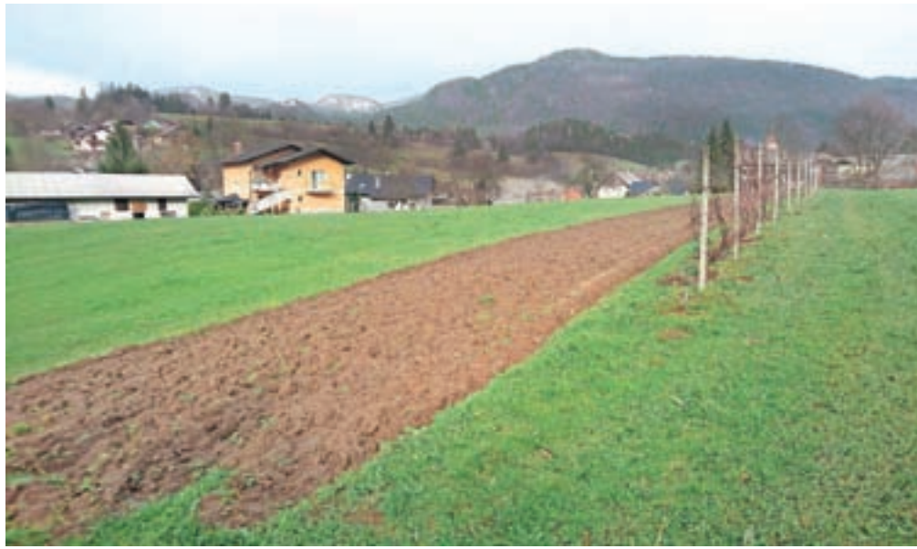
Pogled na Rosovo groblje z zahoda

Mozaik (ti so ena ključnih značilnosti rimskega obdobja) so domačini leta 1880 našli na njivi na nekoliko dvignjenem platoju južno od vasi Šmartno v Tuhinju med vznožjem Ivanjka, Nevljico in današnje potjo za Sidol. Ker je bil mozaik, velik približno meter krat pol metra, že precej razrahljan, ga niso mogli dvigniti v enem kosu, zato so ga prerisali. Takrat naj bi župnik tudi omenil, da naj bi domačini izkopali in shranili tudi nekaj kamnitih sarkofagov. Izročilo v Tuhinjski dolini še