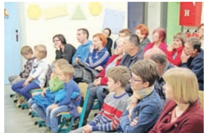
Gledalci so zavzeto spremljali dogajanje.