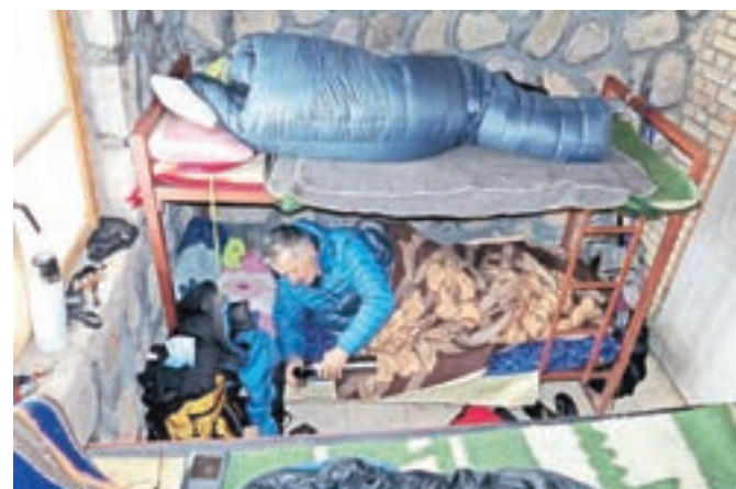
Naša kamra; ni bila velika, smo jo pa zato lažje »pogreli«.

nazdravili šele deset dni kasneje v Istanbulu. V hribih smo preživeli še en lep turnosmučarski dan, potem pa se je vreme dokončno pokvarilo in odpravili smo se na turistični del svoje poti. Najprej smo obiskali Kaspijsko jezero, potem pa še Teheran, Kasha, Abyaneh in Isfahan. Iran je ogromna in zelo raznolika država. V kratkem času ga zato lahko spoznaš le za nekaj kamenčkov v mozaiku. Za nas je bilo še posebno doživetje praznovanje perzijskega novega leta, ki je sicer njihov največji praznik in v katerega so vstopili ob nastopu pomladi, to je 20. marca ob 13.59 po lokalnem času. Pri njih je zdaj leto 1396. Perzijci so po značaju in navadah precej drugačni