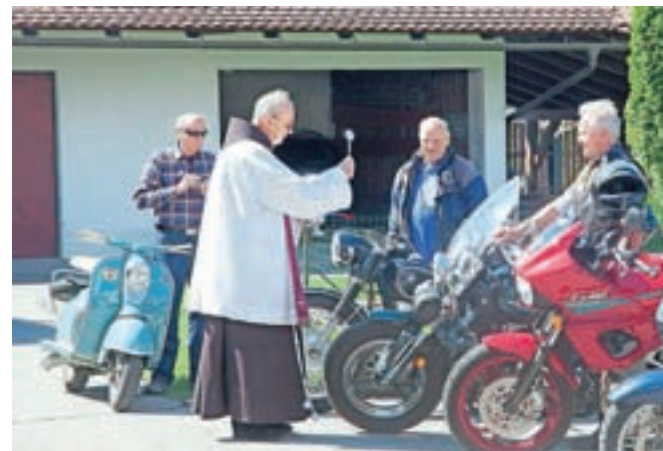
Približno petdeset motoristov se je zbralo na tretjem blagoslovu motorjev v Nevljah.

V Nevljah so pripravili že tretji blagoslov motorjev, na katerem se je zbralo okoli petdeset motoristov.