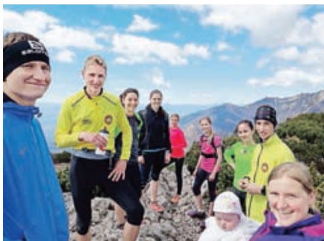
Gorski tekači na Gradišču