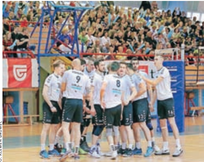
Kamniški odbojkarji se borijo za nov, že četrti naslov državnih prvakov. Potrebujemo še dve zmagi.

»Kozamernik je zelo pomemben igralec za ACH Volley, vendar smo na tej tekmi verjeli vase in v zmagi. Naredili smo tudi manj napak in bili bolj zbrani v ključnih trenutkih tekme. Vendar finalna serija še zdaleč ni odločena, kajti ljubljanci imajo v svoji ekipi veliko reprezentantov, ki imajo več izkušenj od nas, v letošnji sezoni so igrali tudi več mednarodnih tekem. Za naslov državnih prvakov potrebujemo še dve zmagi, do njih pa pridemo lahko le z moštveno igro in ekipnim duhom,« je po slavu v Tivoliju dejal 28-letni Brazilec.