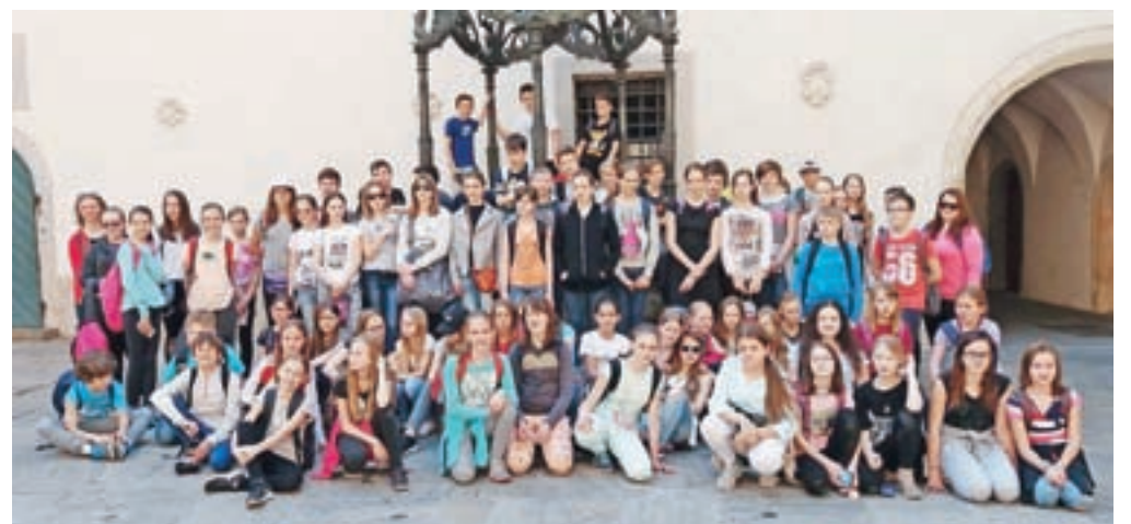
Šestošolci kamniških osnovnih šol so svoje znanje nemščine preizkušali na ekskurziji po Avstriji.

odšli po 250 stopnicah nazaj v mesto in nato proti avtobusu. Na poti domov smo poslušali glasbo in peli. Ob 19.30 smo prispeli domov. Bili smo veseli in utrujeni. Ta dan smo doživeli veliko novega in se imeli zelo lepo.