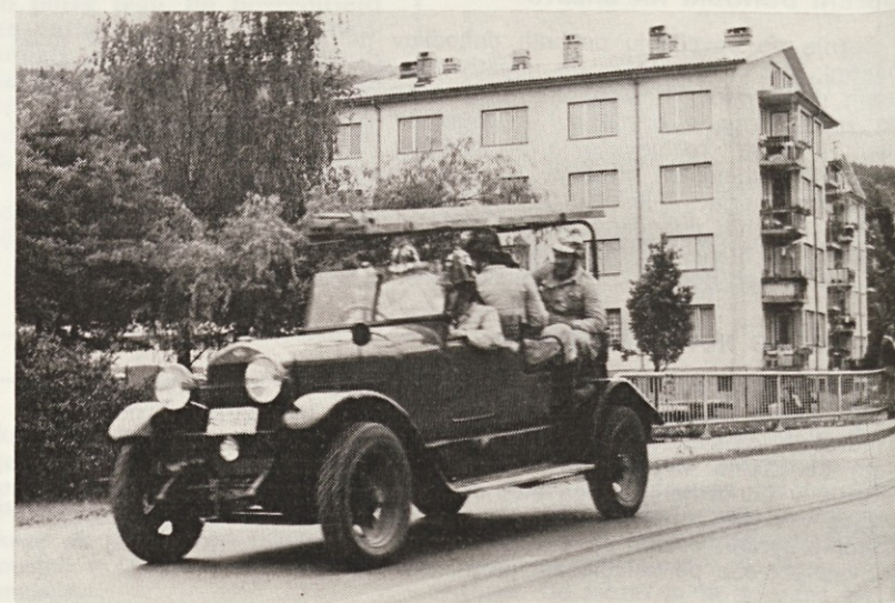
Nekoliko zapoznalo: rally »stari veterani« v Cerknici

Glasilo sodi med proizvode iz 7. točke prvega odstavka 36. člena zakona o obdavčenju proizvodov in storitev v prometu, za katere se ne plačuje temeljni davek od prometa proizvodov (mnenje sekretariata za informiranje izvršnega sveta SR Slovenije št. 421-1/72 z dne 24. oktobra 1974).