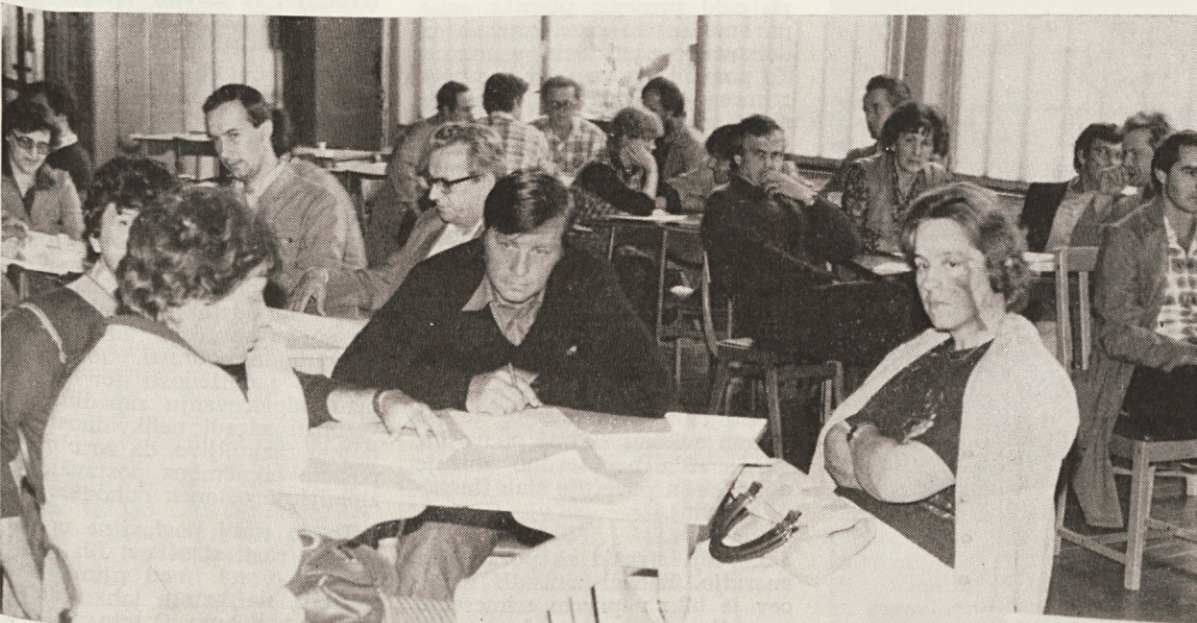
Razširjena seja konference Brestovega sindikata je predlagala referendum o VZD