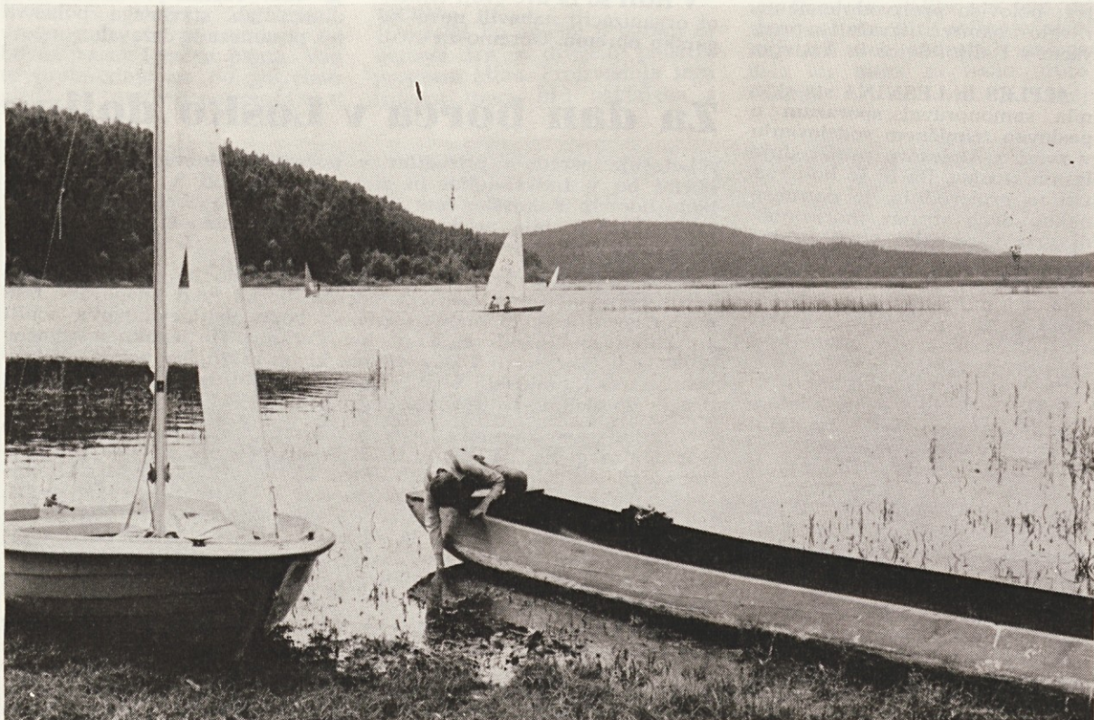
Eno izmed nešteti podob našega jezera

Skupščina sodi, da ostaja ohranjanje, razvijanje in prenašanje tradicij NOB in socialistične revolucije ter njihovo družbljanje tudi v bodoče ena najpomembnejših nalog ZZB. Izročila in vrednote NOB in socialistične revolucije morajo biti vkane v vso našo družbeno prakso in imeti polno veljavo pri razvijanju socialističnega samoupravljanja, krepitvi bratstva in enotnosti, varovanju naše neodvisnosti in suverenosti, v prizadevanjih za mir in širjenje neuvrščene politike. Prenašanje in razvijanje izročil in vrednot NOB in socialistične revolucije mora ustrezati sedanjim stopnjam našega družbenega razvoja, biti mora takšno, da bo predvsem mladim krepilo domoljubno in socialistično zavest, plemenitilo njihove medčloveške odnose in vplivalo na njihov odnos do dela. Za te cilje naj bi se še bolj kot doslej zavzela skupna fronta SZDL in zlasti mladina.