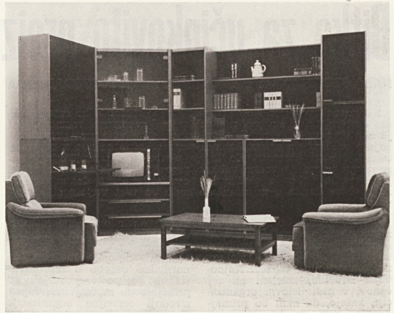
Ena izmed izvedb našega programa 3 x 3

Mesečno moramo analizirati dejanske stroške v primerjavi z normativi in planom po vseh vrstah stroškov, strokovnih mestih in proizvodnih nalogih. Ko