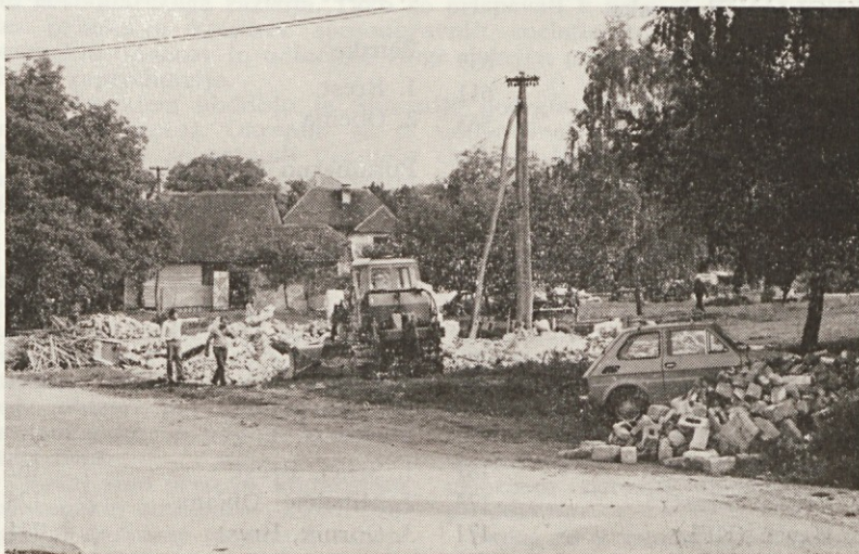
Tukaj naj bi bil nov dom upokoencev

(Iz Informacij RS ZSS za obveščanje v združenem delu)