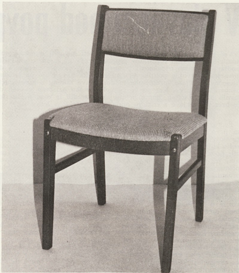
Iz TOZD MASIVA — stol SUHA (za izvoz)

10. Sindikati v temeljnih organizacijah se bodo morali začeti ukvarjati tudi s podružbljanjem kulture. Potrebno bo pretehtati možne oblike za približanje kulturnih dobrin delavcem in zato tesneje sodelovati z občinsko