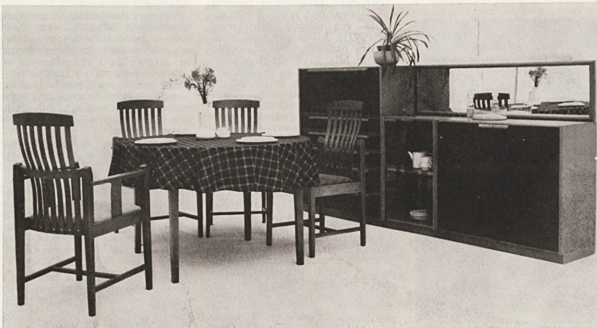
Še ena možnost za postavitev programa 3 x 3