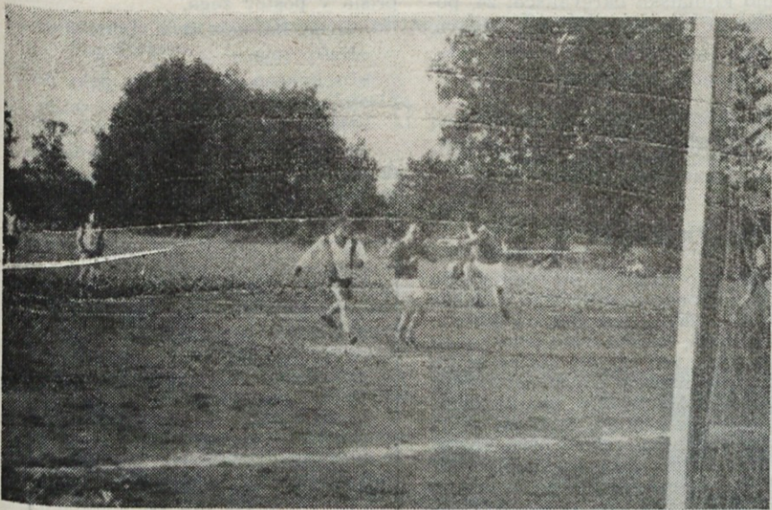
S tekme »stari« : »mladi« : nevarna situacija pred »mladim« golom