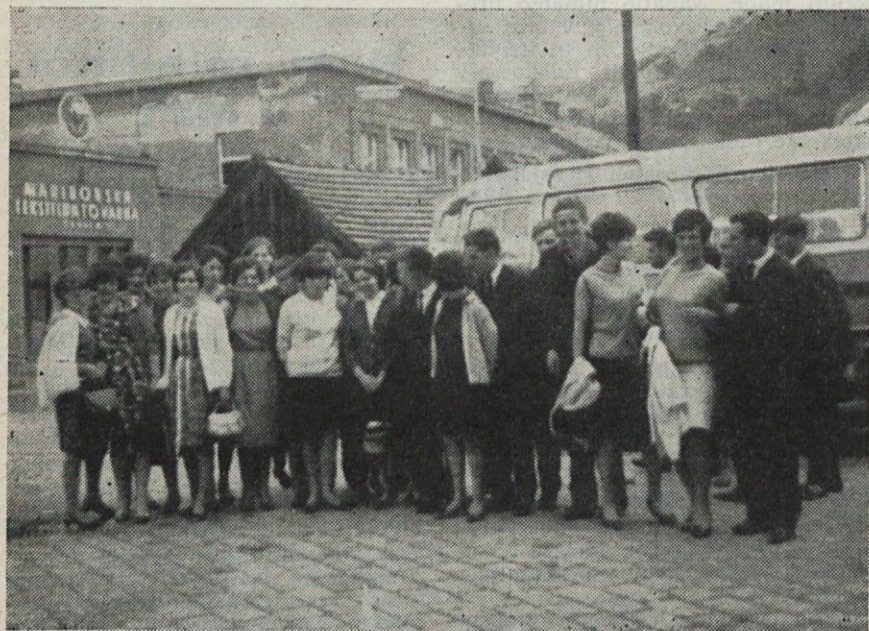
Naši mladinci v MTT