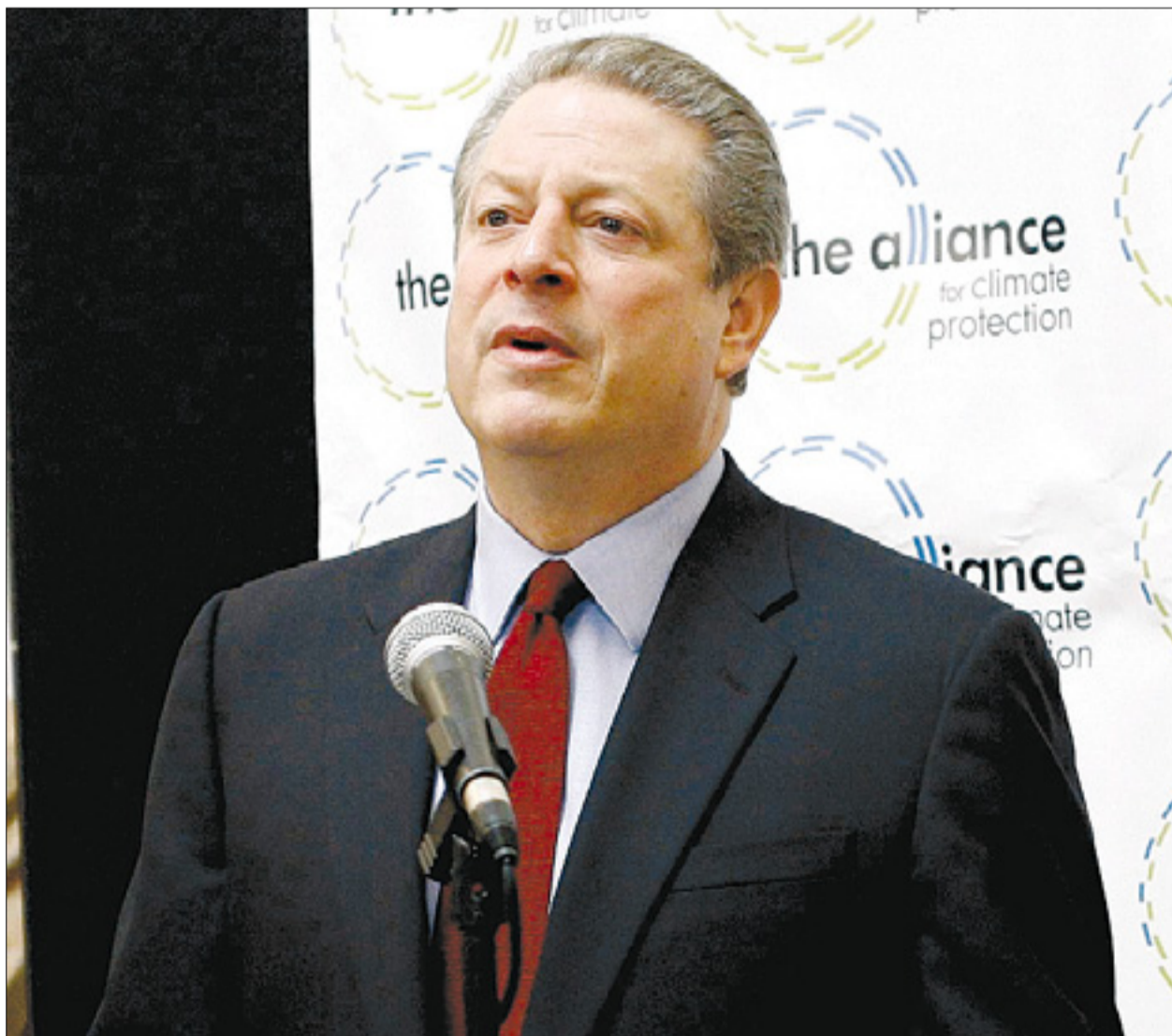
Al Gore ob objavi novice, da je prejel Nobelovo nagrado za mir

OSLO - Nekdanji ameriški podpredsednik in letošnji Nobelov nagrajenec za mir Al Gore je včeraj izključil možnost, da bi vstopil v tekmo za ameriškega predsednika "Ne načrtujem, da bi bil spet kandidat, zato jo resnično sploh ne vidim v tem kontekstu," je na vprašanje novinarja, ali se mu po prejemu prestižne Nobelove nagrade prebudi tudi ambicije po Beli hiši, odgovoril 59-letni Gore.