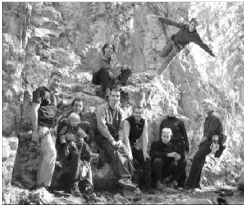
Udeleženci alpinističnega tečaja SPDT

Nedeljskega slavlja na Slavniku, ki je potekalo v sproščenem in živahnem planinskem vzdušju, so se udeležile številne delegacije sorodnih planinskih društev iz vse kraške in istrske okolice, s Tržaškega in iz Ljubljane, ki so se na Slavnik potrudile z vseh smeri: iz Prešnice, Podgorja, Hrpej in Skadanaščine. Pohodnike in goste je na slovesnosti pozdravil predsednik