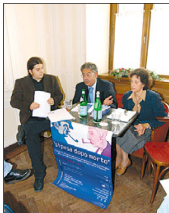
Včeraj so predstavili niz pobud

Opus Umberta Sabe je pomemben za tržaško, a tudi za italijansko kulturno zgodovino, zato bodo razpravljali o njegovem delu razpravljali na velikem kongresu, ki bo na sredi novembra v Milanu. (ROP)