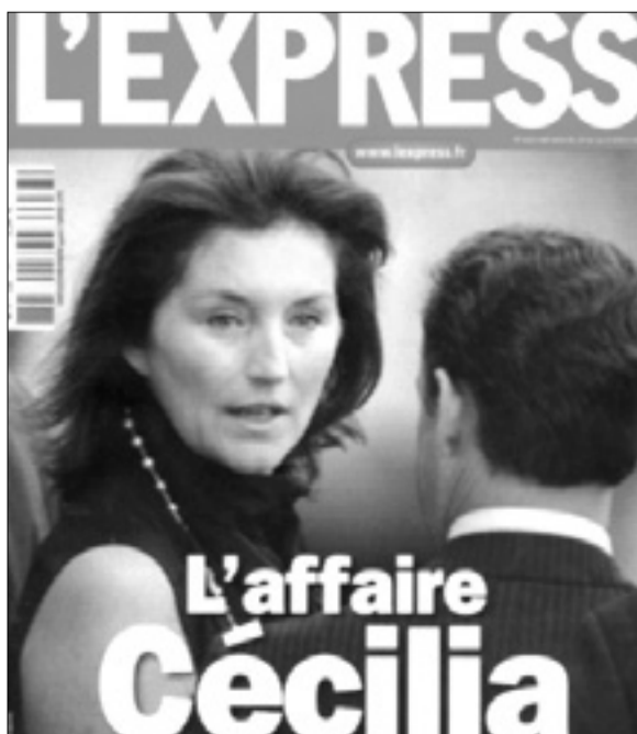
Naslovna stran tednika L'Express s sliko zakoncev Sarkozy