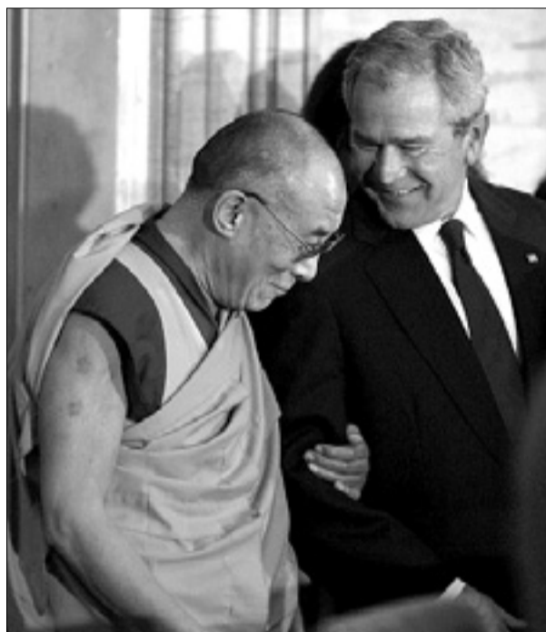
Dalajlama in George Bush

Dalajlama se je zahvalil za čast in opozoril na problem kitajske politike priseljevanja v Tibet, zaradi česar Tibetanci postajajo manjšina v svoji domovini. Prav tako je opozoril na slabo okoljevarstveno politiko, ki vpliva na čistost izvirov pomembnih rek v Tibetu, sicer pa je predvsem pozival kitajske oblasti k dialogu in zagotavljal, da ga ne zanima noben politični položaj, za Tibet pa le verska in kulturna avtonomija. (STA)