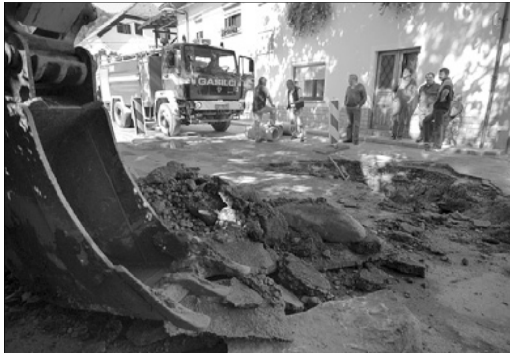
Vodna ujma je tudi v Cerkljem povzročila precej škode