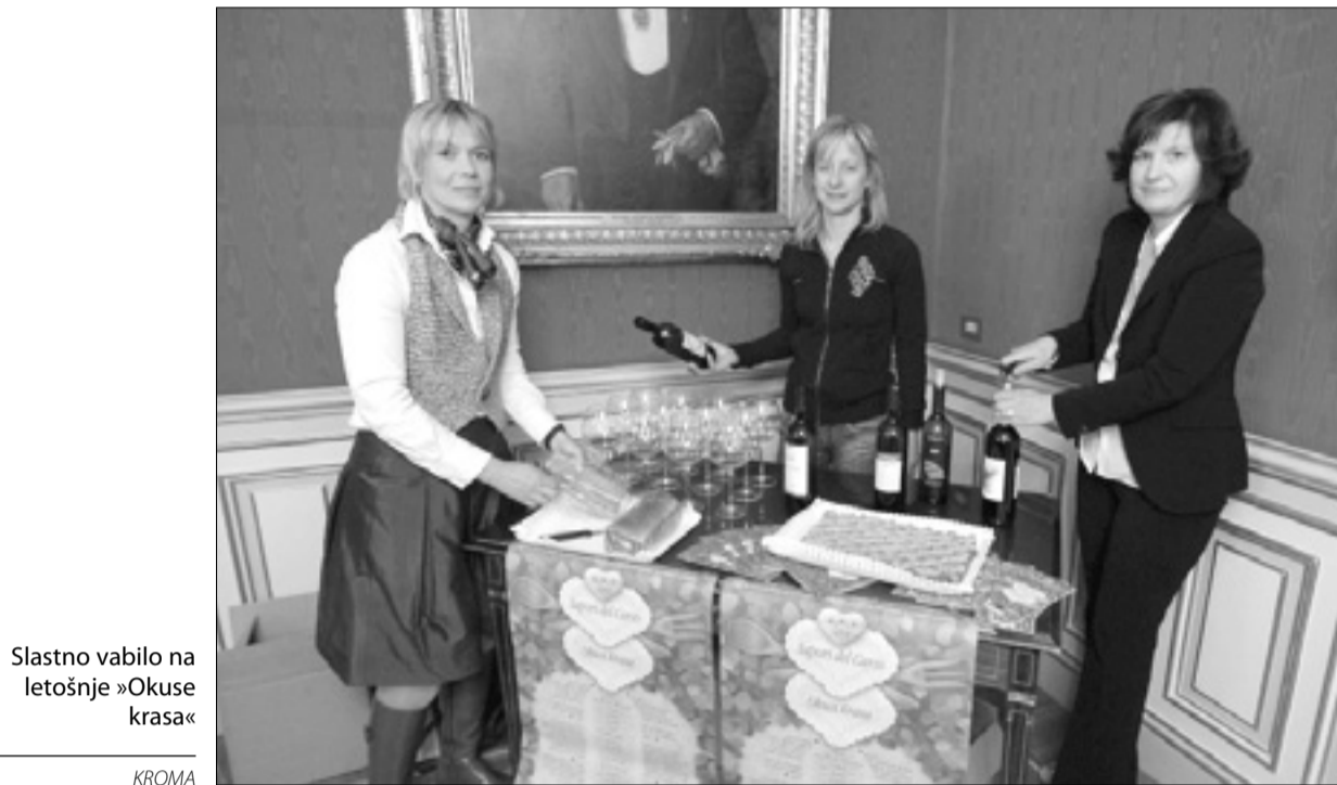
Slastno vabilo na letošnje »Okuse krasa«

Šestnajst gostiln s Tržaškega in dve z Goriškega bo torej letos v sklopu že tradicionalne pobude, ki jo prireja gostinska sekcija in sekcija trgovine na drob-