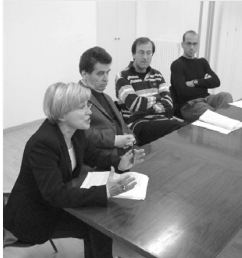
Urednica in nekateri izmed avtorjev publikacije (levo), desno pa publikacija

Na večeru so ob vsebini publikacije govorili tudi o nekdanjem živahnem kulturnem življenju