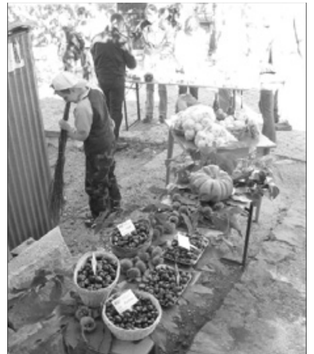
Kostanj je glavni protagonist burnjaka