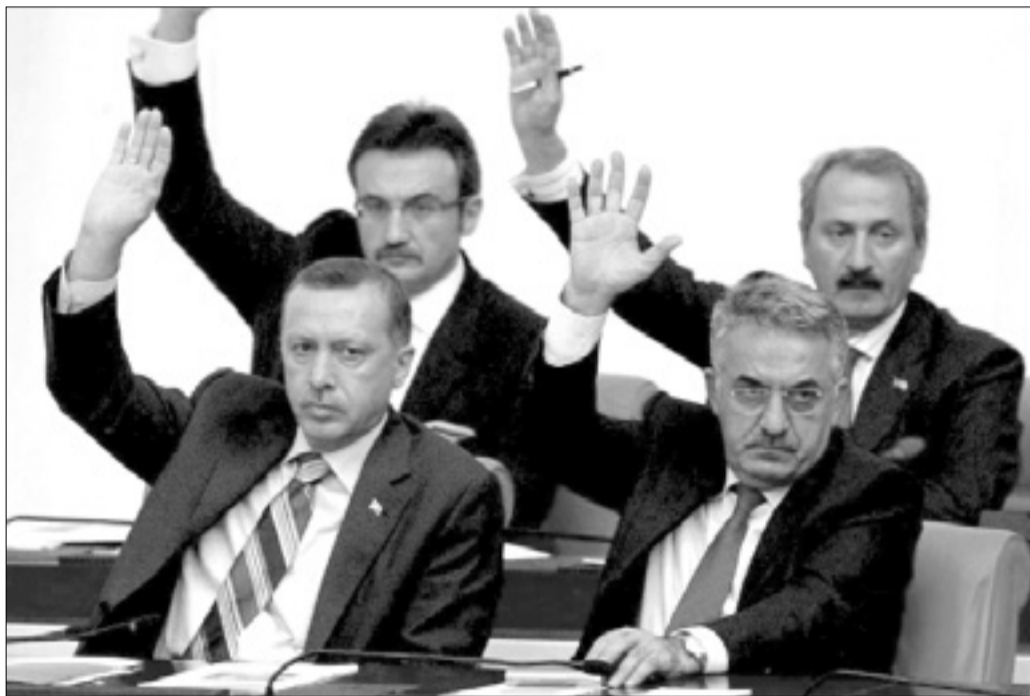
Premier Recep Tayyip Erdogan in nekateri ministri med glasovanjem v parlamentu

Turške oblasti sicer predvsem jezi, ker si vse več kurdskih upornikov poišče zatočišče v sosednjem Iraku. Poleg tega naj bi PKK, ki jo imajo Turčija, ZDA in večji del mednarodne skupnosti za teroristično organizacijo, svoja oporišča na severu Iraka uporabljala za napade na turške cilje. (STA)