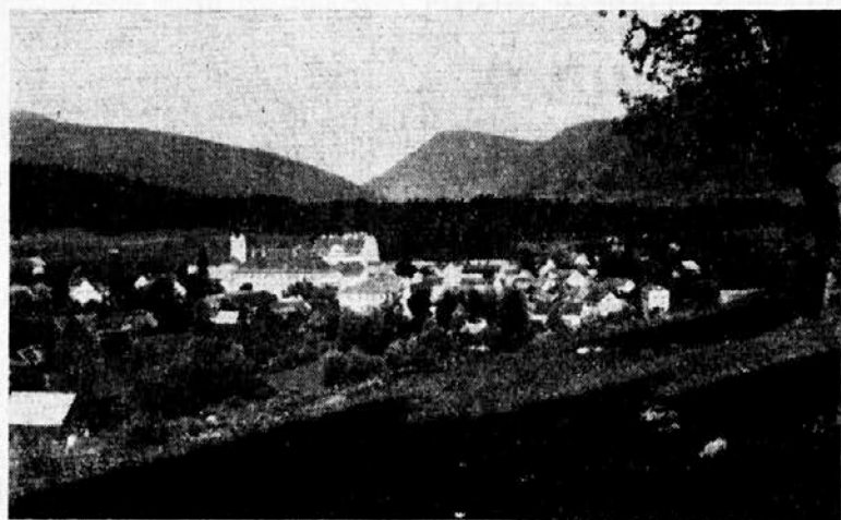
Dolenjske Toplice — seveda na Dolenjskem