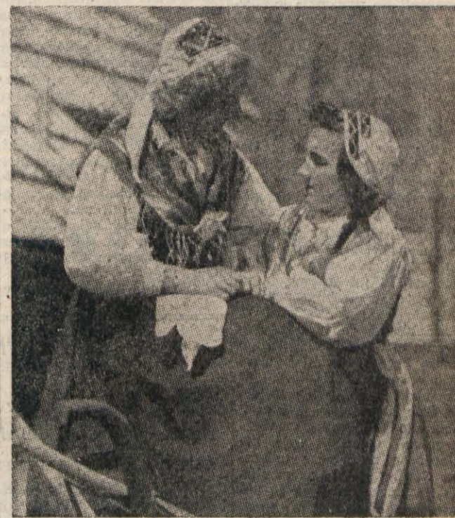
Slovenska dekleta v narodni noši