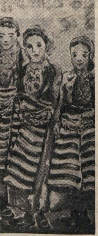
Maleš: Makedonske deklice (monotipija)