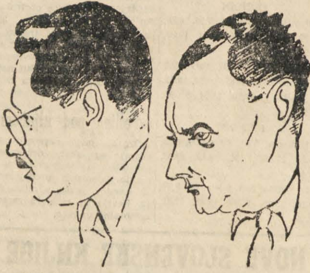
EDVARD KARDELJ šef jugoslavanske delegacije