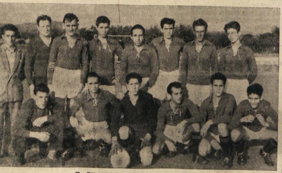
Bo Olimpija jutri uspeša proti Mezgecu?