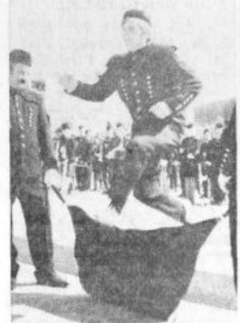
Skočil je čez kožo in postal rudar