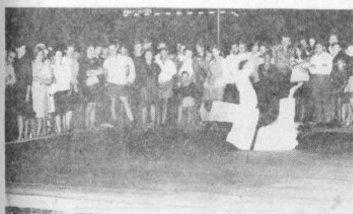
Gledalci so z zanimanjem spremljali nastop judoistov