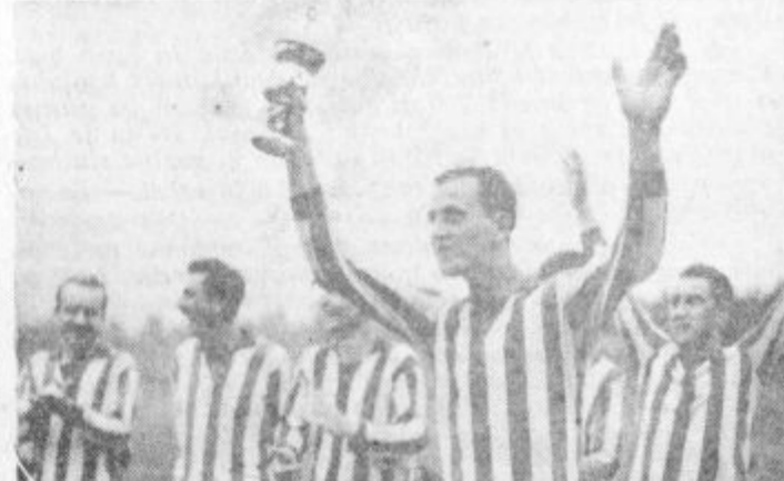
Nogometaši klasirnice z zasluženim in povržtvovalno priborjenim pokalom