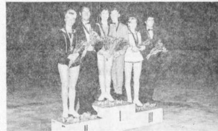
Zmagovalci v plesnih parih

* Organizacija tekmovanja, ki je bila v rokah domačega državnega kotalkarskega kluba, je bila odlična. Vsi udeleženci so se zadovoljni razšli z željo, da se prihodnje leto ponovno srečajo v Velenju v še večjem številu.