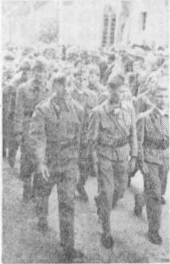
V veliki gasilski paradi v Šaleku so sodelovali tudi najmlajši gasilci