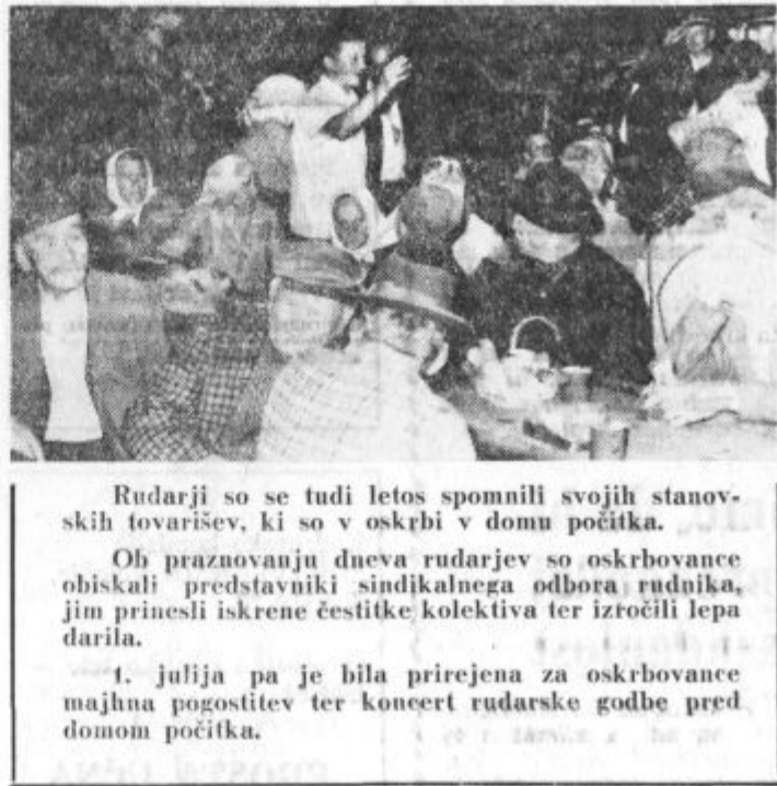
Rudarji so se tudi letos spomnili svojih stanskih tovarišev, ki so v oskrbi v domu počitka.

Ob praznovanju dneva rudarjev so oskrbovance obiskali predstavniki sindikalnega odbora rudnika, jim prinesli iskrene čestitke kolektiva ter izročili lepa darila.