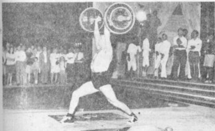
Na akademiji pred kulturnim domom je sodeloval tudi težkoatletski klub