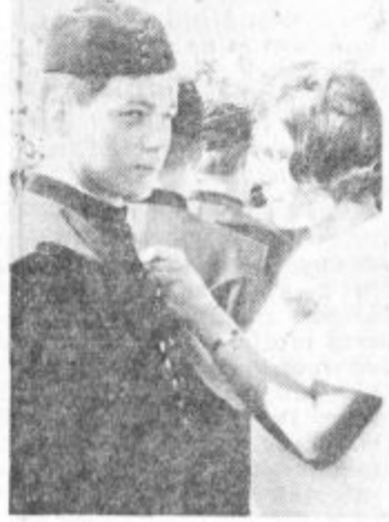
Dekle mu je pripelo rdeč nagelj

strani pa je prehod na intenzivnejše gospodarstvo povzročil velike probleme na področju zaposlovanja v naši občini.