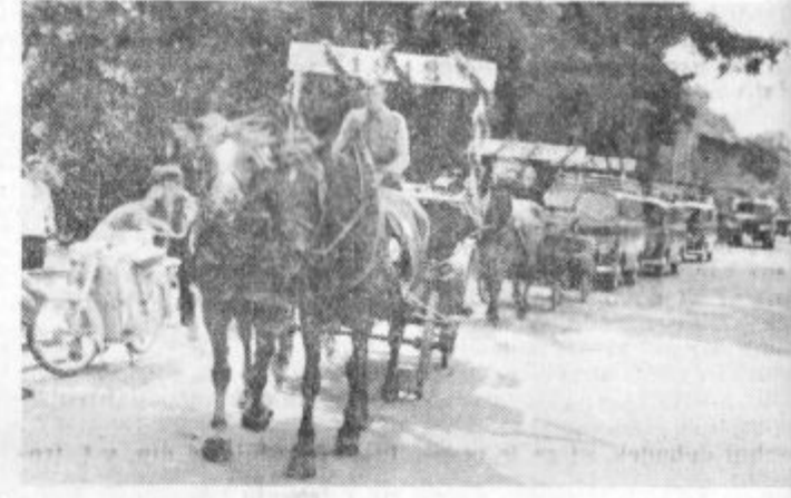
Castiljiva veterana iz l. 1912 in 1930