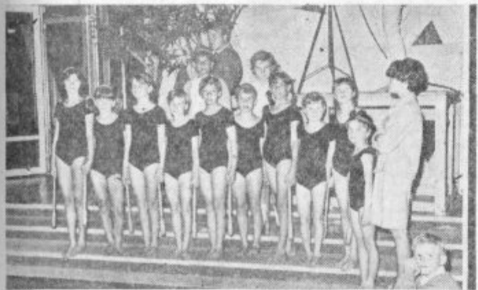
Zelo uspelo točko je pripravila baletno ritmična skupina TVD Partizan Soštanj