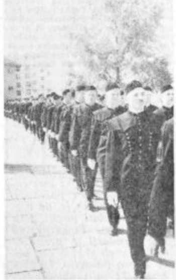
Parada črnouniformiranih rudarjev