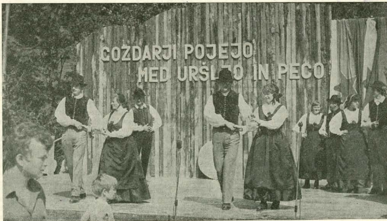
Folklorna skupina TOZD Gozdarstva Črna

62390 RAVNE NA KOROŠKEM STUDIJSKA KNJIŽNICA RAVNE