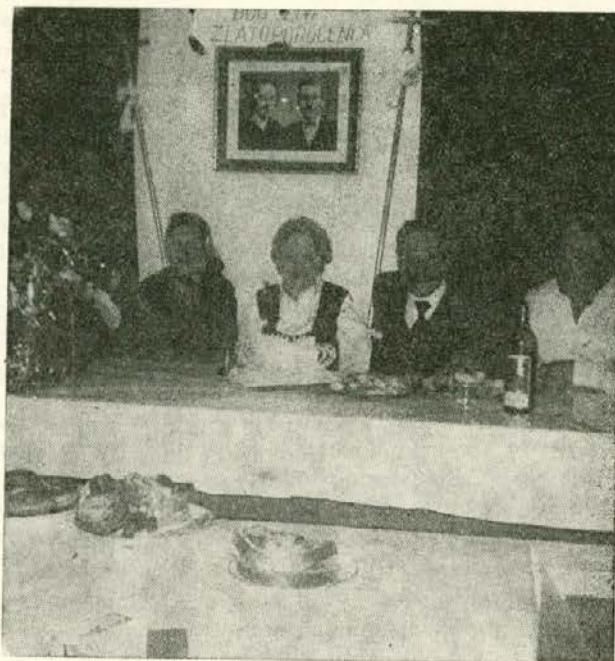
Slavljenca s pričama