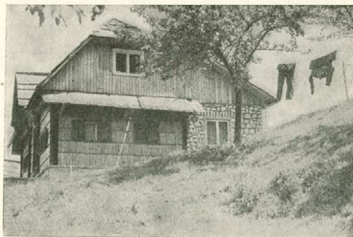
Domačija našega gozdarja na Pohorju