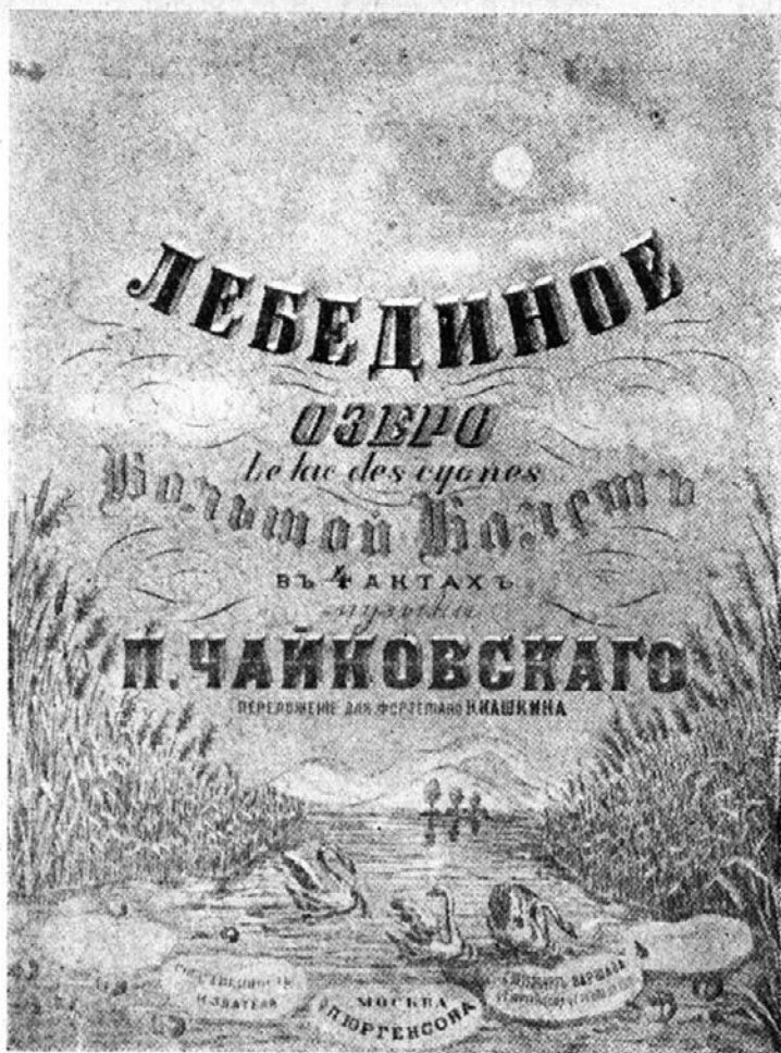
Naslovna stran klavirskega izvlečka