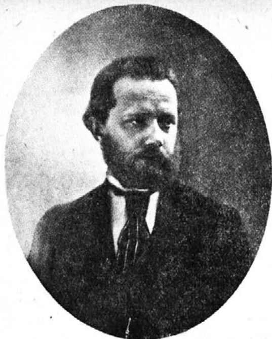
PETER ILJIČ ČAJKOVSKI

poskušamo, če le mogoče, izvesti vsako delo v celoti in tako, kot je bilo prvotno od avtorjev zamišljeno. In če je sedaj tako baletno delo kar štiri dejanja dolgo in izpolni cel večer, nas to ne moti, saj ravno mi v Ljubljani zavestno gojimo poleg krajših tudi celovečerne balette.