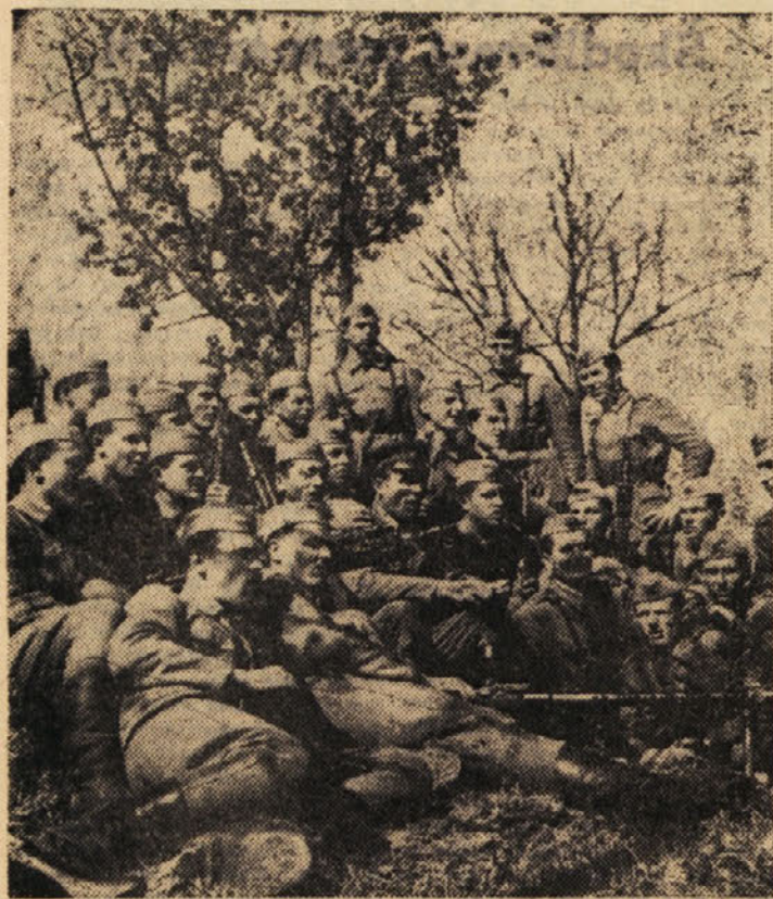
Razgovor o dnevnih novicah sedi k vojaškemu žiljenju