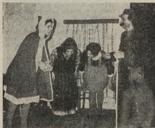
Prizor iz igrice »Dedek Mraz prihaja«

Pred novim letom je dramska sekcija »Svobode« priredila za učence obeh kočevskih šol igrice »Dedek Mraz prihaja«. Nastopali