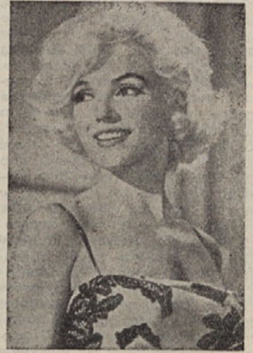
Zvezda ameriškega filma MM je lani napravila samomor

Morda bomo v filmu »Avtobusna postaja«, ki bo 28. in 29. januarja na sporedu v kinu Jadran Kočevje, zadnjikrat videli lani umrlo zvezdo ameriškega filma Marilyn Monroe. Zaslovela je predvsem zaradi svojih telesnih odlik, o njenem igral. talentu pa so veliko govorili. Šele s filmom »Princ in igralka«, ki smo ga gledali tudi pri nas, je dokazala svoje igralske sposobnosti. Njen naslednji film »Avtobusna postaja« je to še enkrat potrdil. V filmu igra barsko pevko na ameriškem zahodu, v katero se zaljubi mladi in ognjevit kavboj (Don Murray). Mnogo smešnih zapletljajev, dobra igra obeh igralcev in lepe barve bodo pritegnile gledalce.