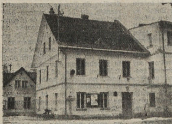
Sem se je preselila ribniška ljudska knjižnica