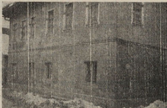
»Pramec« Noetove barke v Dolenji vasi

Tri leta za ureditev štirih sta-novanj je pa le malo preveč! Zato smo se pozanimali pri izva-