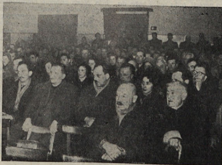
Z zbora volivcev v Ribnici