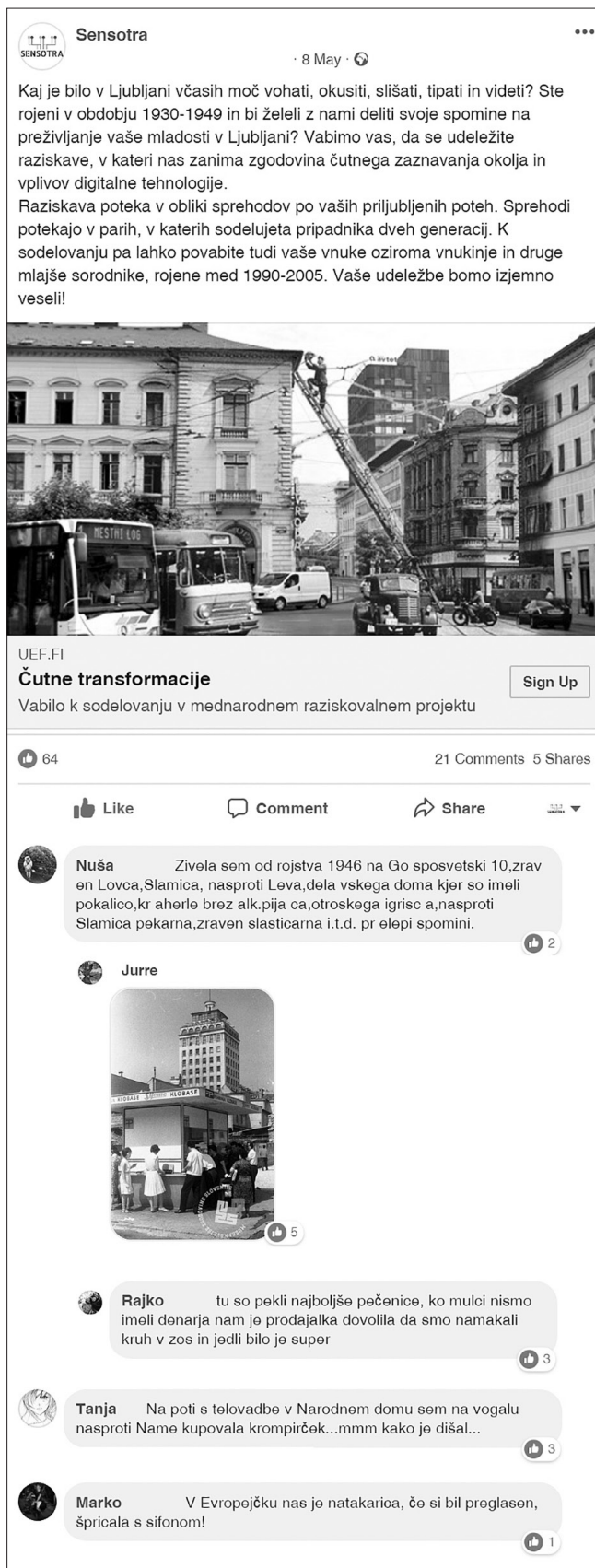
Slika 2: Prirojeni posnetek zaslona razprave na družbenem omrežju Facebook med potencialnimi sodelujočimi, 8. 1. 2018.

no obdobje stanovali v okolici, zahajali v kavarno Evropa, obiskovali gostilno Figovec). Ob njeni upodobitvi, ki, kot rečeno, (ra)združuje »takrat« in »danes«, pa so spomini na takratno obdobje in najrazličnejše čutne zaznave ter z njimi povezane pripetljaje privreli na dan tako rekoč sami od sebe, komentarji drugih pa so tok spominjanja le še dodatno spodbudili.