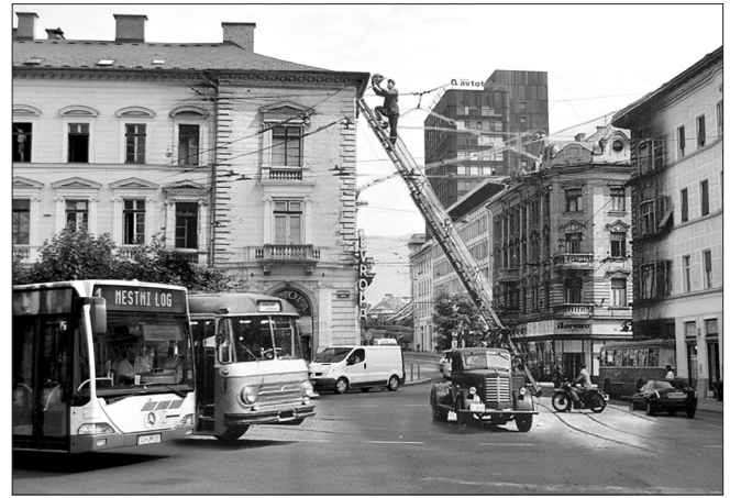
Slika 1: Razglednica SENSOTRA. Fotomontaža: Sandi Abram, 2017.

janja v umetnosti glej Schneider 2003), se hoja kot način ustvarjanja ali kot umetniško delo tako kar sama ponuja kot kontrapunkt čutnobiografskim sprehodom (o hoji v umetnosti več v nadaljevanju). Na enak način obravnavamo tudi dela tistih sodelujočih, ki se sicer nimajo za umetnike, a so z nami pripravljene deliti svoje stvaritve.