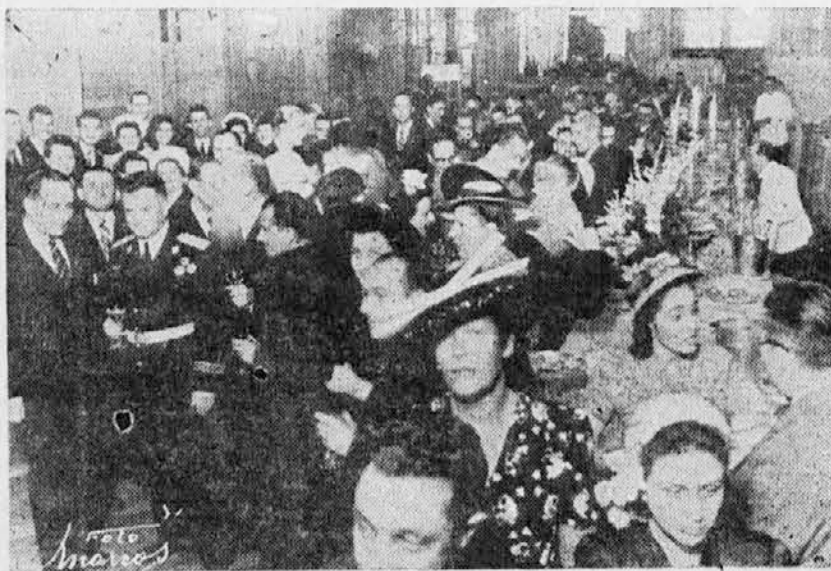
Del prisotnih na sprejemu v Alvear Palace.

V tem razdobju so bili doseženi odločujoči uspehi. Odbite so bile IV. in V. sovražna ofenziva, v katerih borbah so