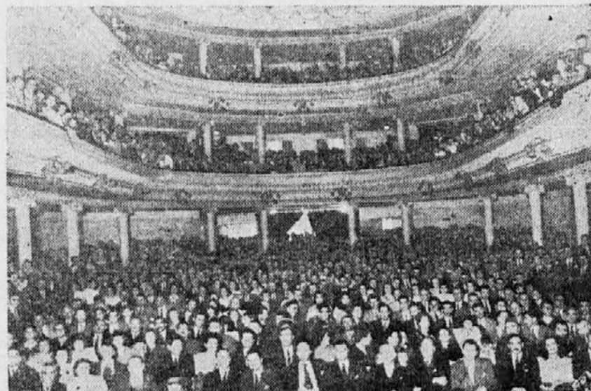
Pogled na občinstvo v gledališču "Apolo" ob priliki proslave 29. Novembra

Govor g. Ministra je bil večkrat prekinjen z burnim ploskanjem in vzkliki maršalu Titu in Jugoslaviji.