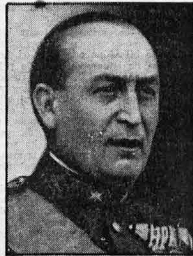
Madžarski ministrski predsednik Gömbös je prejšnji teden med zdravljenjem v Nemčiji umrl

To je bil tisti vzrok, ki je raztegnil ministrsko sejo skoraj na 20 ur: treba je bilo najti izhod iz kočljivega položaja. In žilavi Schuschnigg ga je našel: Baar in