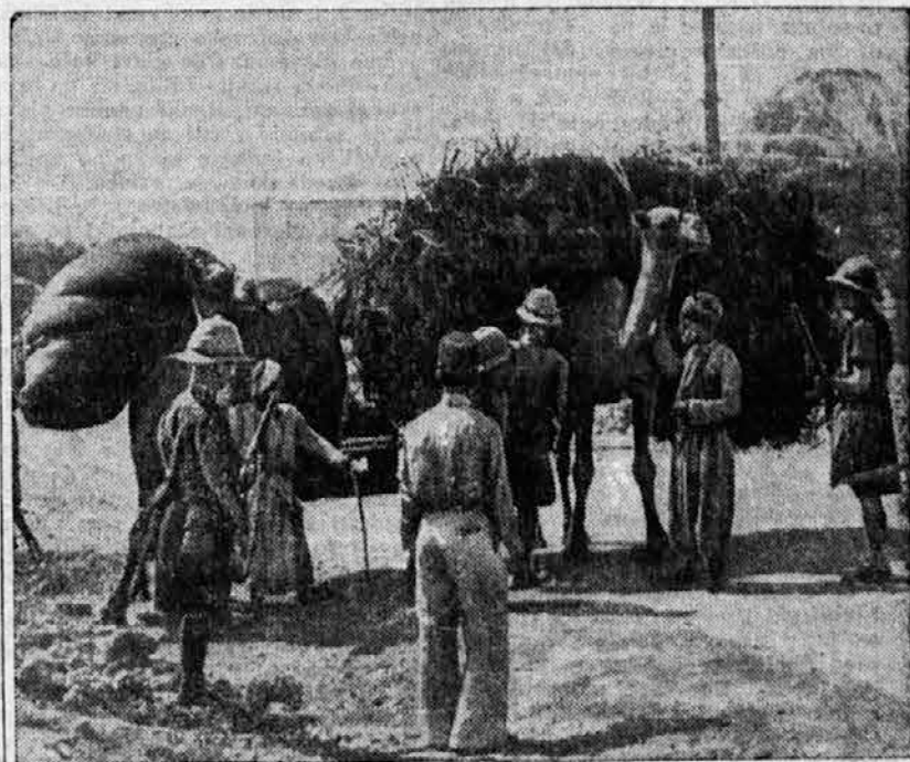
Zaradi neprestanih neredov so angleške vojaške oblasti v Palestini prisiljene pregledati vsak tvor, ki ga domačini prinesejo v mesto. Le tako lahko preprečijo tihotapstvo orožja za nezadovoljne domačine, ki jim priseljevanje in bogatenje Židov ne gre v račun