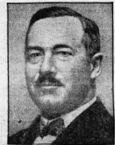
Dosedanji podpredsednik madžarske vlade Darányi je po Gömbösevi smrti postal ministrski predsednik

Draxler sta najprej odstopila in še prosvetni minister Pertner z njima in zvezni predsednik je njihov odstop vzel na znanje — a koj nato jih je na novo imenoval na ista mesta, s to razliko, da zdaj niso bili več vezani na heimwehr. Tako je bil volk sit in koza cela, če nam